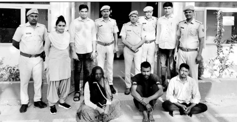
युवक की हत्या के मामले में पुलिस ने तीन को गिरफ्तार किया।

अजमेर, (कासं)। नसीराबाद के राजगढ़ गांव में एक युवक की हत्या के मामले में एक महिला सहित तीन लोगों को गिरफ्तार किया गया है। हत्या आपसी रंजिश में की गई थी। कुल्हाड़ी से वार कर उसे जान से मारा गया था। पुलिस ने चौबीस घंटे में मामले का खुलासा कर लिया।