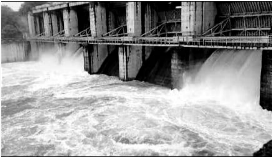
करौली जिले के सबसे बड़े बांध पांचना से पानी की निकासी की जा रही है।