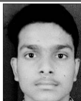
मृतक चचेरे भाई।