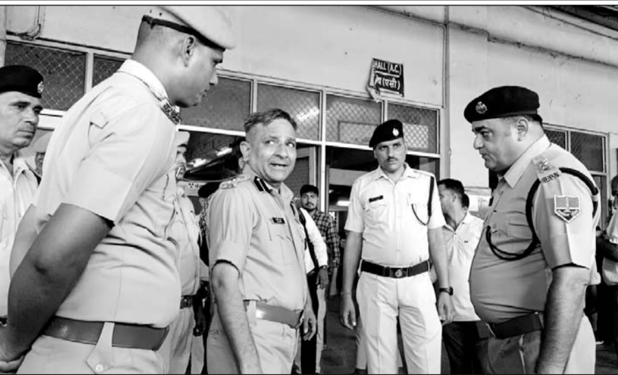
वारदात के बाद अजमेर रेलवे स्टेशन का जीआरपी एसपी ने मौका मुआयना किया।

अजमेर, (कास)। अजमेर रेलवे स्टेशन पर मासूम बच्चियों के अपहरण और दुराचार की बारदातें धमके का नाम नहीं ले रही हैं। मंगलवार देर रात ऐसा ही एक मामला सामने आया, जब अजमेर स्टेशन के प्लेटफार्म नंबर संख्या एक से 4 साल की मासूम बालिका अपहरण हो गया। बालिका का परिवार सिरौही से दरगाह जियायत के लिए अजमेर आया था और गंतव्य स्थान पर जाने के लिए स्टेशन के प्लेटफार्म पर ट्रेन का इंतजार कर रहा था। घटना के बाद जीआरपी, आरपीएफ और रेलवे अधिकारियों ने तत्परता दिखाते हुए आरोपी को दस घंटे के अंदर अहमदाबाद के चांदोलिया रेलवे स्टेशन पर पोरबंदर एक्सप्रेस से गिरफ्तार कर लिया और बच्ची को सुरक्षित कब्जे में ले लिया। आरोपी को पुलिस टीम देर अजमेर लेकर आई।