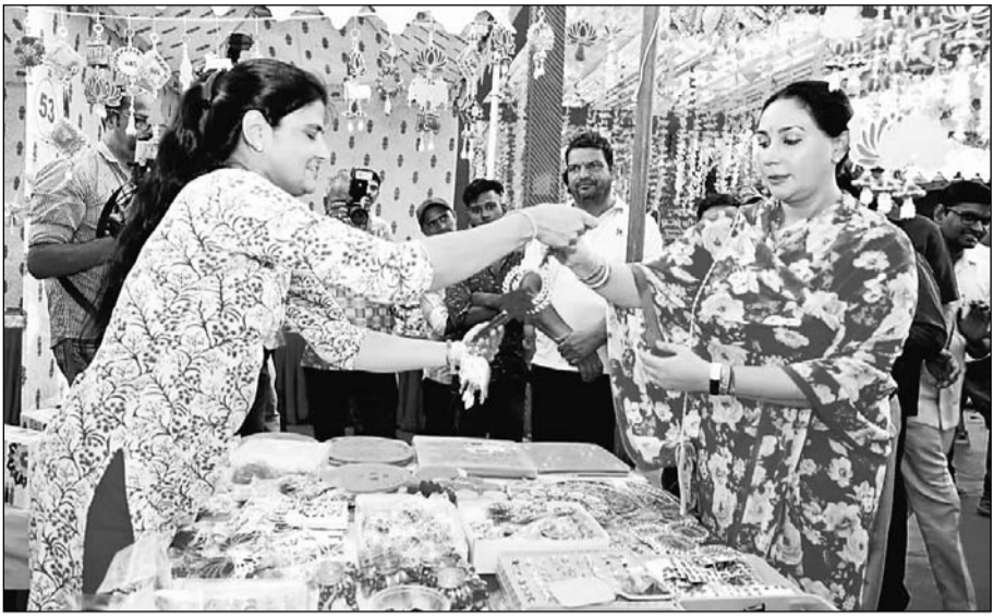
उपमुख्यमंत्री दिया कुमारी ने जवाहर कला केंद्र में आयोजित राज्य स्तरीय अमृता हाट में खरीदारी की।

उन्होंने इस अवसर पर मीडिया से बात करते हुए कहा कि राज्य सरकार महिला हस्तकारों को मौक़ा, मंच और मार्केट देने के लिए प्रयासरत है। दिया कुमारी ने कहा कि स्वयं सहायता सामूह की महिलाओं द्वारा निर्मित हस्त निर्मित