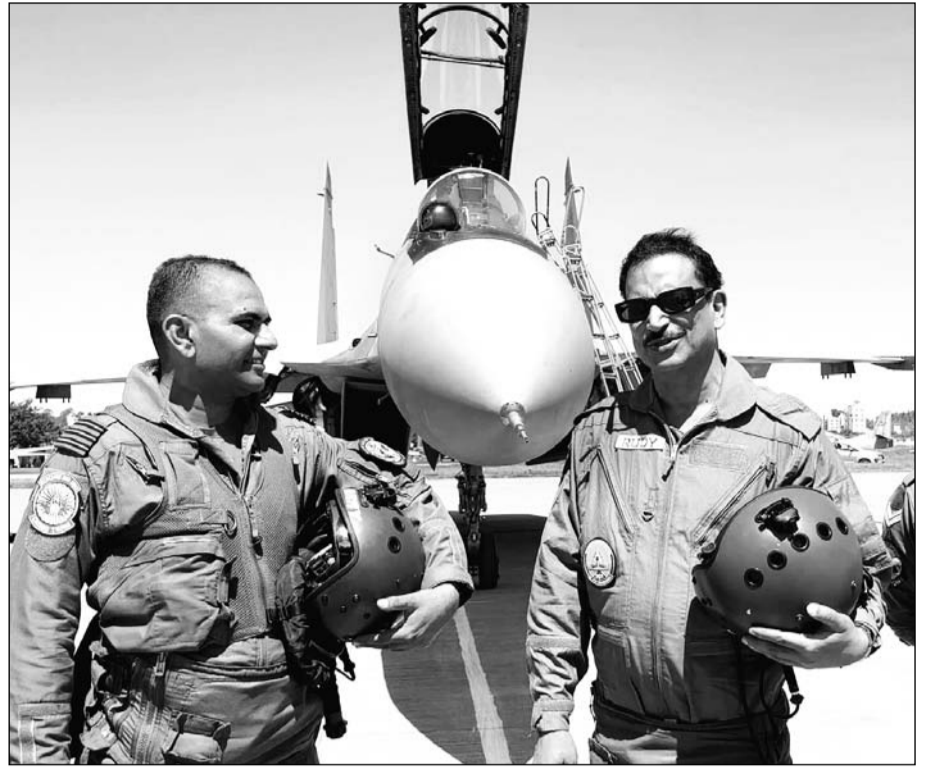
पूर्व नागरिक उड्डयन मंत्री और सारण सांसद राजीव प्रताप रूडी ने भारतीय वायुसेना के अत्याधुनिक लड़ाकू विमान सुखोई-30 एमकेआई में उड़ान भरते हुए अपनी उड़ान क्षमता और साहस का प्रदर्शन किया।

बेंगलुरु/जयपुर। पूर्व नागरिक उड्डयन मंत्री और सारण सांसद राजीव प्रताप रूडी ने भारतीय वायुसेना के अत्याधुनिक लड़ाकू विमान सुखोई-30 एमकेआई में उड़ान भरते हुए अपनी उड़ान क्षमता और साहस का प्रदर्शन किया। उन्होंने 12 फरवरी को बेंगलुरु में आयोजित एयरो इंडिया 2025 एयर शो में 22,000 फीट की ऊँचाई पर 52 मिनट तक शानदार कलाबाजियाँ की।