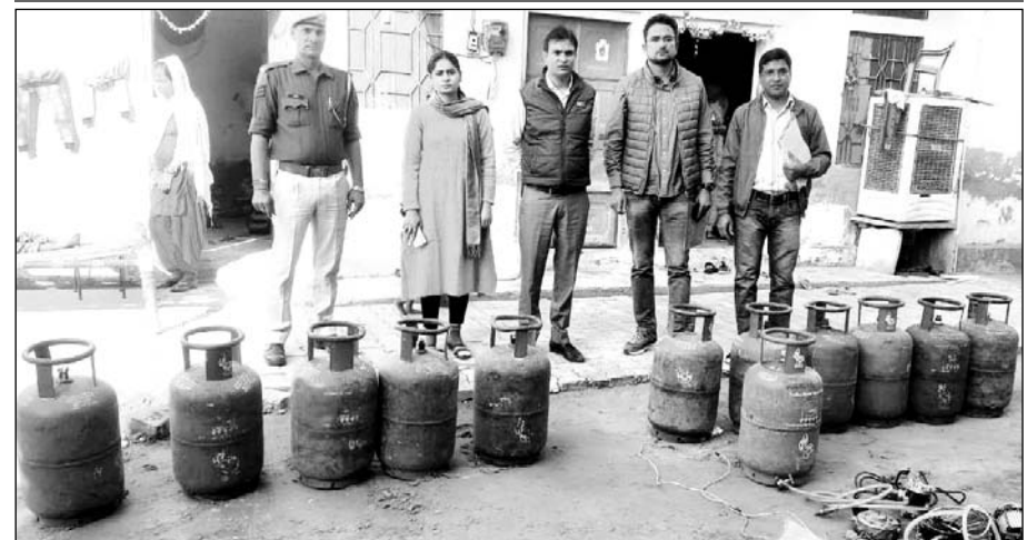
रसद विभाग की टीम ने बानसूर रोड पर गैस की अवैध रिफिलिंग करने वालों के खिलाफ कार्रवाई की।

15 घरेलू गैस सिलेंडर, 3 इलेक्ट्रिक मोटर व रिफिलिंग का सामना जप्त किया