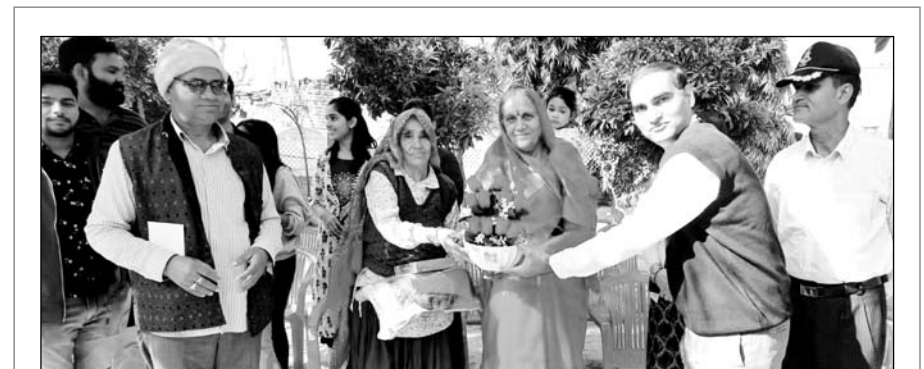
सूरजगढ़ : उपराष्ट्रपति की पत्नी डॉ. सुरेश धनखड़ ने सूरजगढ़ पहुंच अपनी काक सास कमला देवी व परिवार जनों के हालचाल जाने। पत्रकारों से बातचीत करते हुए डॉ. सुरेश धनखड़ ने बताया कि प्रधानमंत्री नरेन्द्र मोदी के नेतृत्व में देश विकास के नए आयाम स्थापित कर रहा है। उपराष्ट्रपति जगदीप धनखड़ के बारे में बताते हुए उन्होंने कहा कि जमीन से जुड़ा नेतृत्व मिला है। गांव, गरीब किसान के लिए उन्होंने जो किया है वह समाजिक जीवन में रह रहे हर व्यक्ति के लिए उदहारण है।

भीलवाड़ा, (निर्स) । भारत जोड़ो यात्रा में शामिल होकर लौट रहे धुवाला के जीप चालक की सड़क हादसे में हुई मौत के बाद चिरंजीवी योजना के तहत 5 लाख रुपए की आर्थिक सहायता परिजनों को उपलब्ध करवाई गई है। जिला कलेक्टर आशीष मोदी ने बताया कि पिछले दिनों भारत जोड़ो यात्रा में शामिल होने के बाद लौट रहे जहाजपुर के धुवाला निवासी रामचन्द्र मीणा की जीप ट्रेलर धिड़ंत में मौत हो गई थी। मृतक के परिजनों को चिरंजीवी योजना के तहत 5 लाख रुपए की राशि स्वीकृत की गई है। इस गांव में सड़क निर्माण की स्वीकृति भी दी गई है।