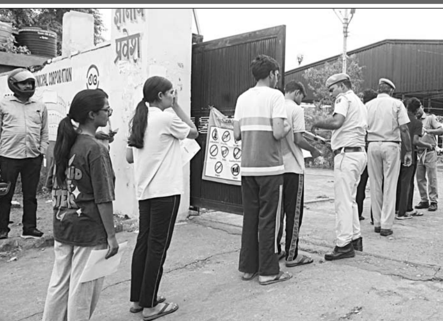
नीट परीक्षा देने पहुंचे अभ्यर्थियों को परीक्षा केंद्र में प्रवेश देने से पूर्व पुलिस ने उनकी गहनता से जांच की।

-कार्यालय संवाददाता- जयपुर। राष्ट्रीय पात्रता सह प्रवेश परीक्षा (नीट-यूजी) की पुनः परीक्षा रविवार को राजधानी जयपुर में कड़े सुरक्षा प्रबंधों और प्रशासनिक निगरानी के बीच शांतिपूर्ण एवं सुव्यवस्थित ढंग से संपन्न हुई। जयपुर जिले के 103 परीक्षा केंद्रों पर आयोजित परीक्षा में 37128 अभ्यर्थी पंजीकृत थे। जिनमें से 34031 अभ्यर्थी उपस्थित रहे, जबकि 3,097 अनुपस्थित रहे। इस प्रकार कुल उपस्थित 91.66 प्रतिशत दर्ज की गई। परीक्षा दोपहर 2 बजे शुरू होकर शाम 5:15 बजे समाप्त हुई। नेशनल टेस्टिंग एजेंसी (एनटीई) ने अभ्यर्थियों को 15 मिनट का अतिरिक्त समय दिया। परीक्षा समाप्त होने के बाद 22 गोदाम सिकल, परकोटा क्षेत्र के प्रमुख बाजारों तथा शहर के कई व्यस्त मार्गों पर परीक्षाार्थियों और उनके परिजनों की भीड़ उमड़ने से यातायात व्यवस्था प्रभावित नहीं और कई स्थानों पर वाहन रंगते नजर आए। परीक्षा की संवेदनशीलता को देखते हुए इस बार अभूतपूर्व सुरक्षा व्यवस्था की गई थी। अभ्यर्थियों को परीक्षा केंद्र में प्रवेश से पहले श्री-लेयर सिक्वोरिटी जांच से