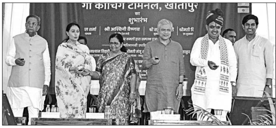
केंद्रीय रेल मंत्री अश्विनी वैष्णव और मुख्यमंत्री भजनलाल शर्मा ने रविवार को जयपुर के खातीपुरा रेलवे स्टेशन से जयपुर-दरभंगा अमृत भारत एक्सप्रेस रेल सेवा को हरी झंडी दिखाकर रवाना किया। इस मौके पर उपमुख्यमंत्री दीपा कुमारी तथा सांसद घनश्याम तिवारी व सांसद मंजू शर्मा मौजूद थे।

-कार्यालय संवाददाता- जयपुर। केंद्रीय रेल मंत्री अश्विनी वैष्णव और मुख्यमंत्री भजनलाल शर्मा ने रविवार को जयपुर के खातीपुरा रेलवे स्टेशन से जयपुर-दरभंगा अमृत भारत एक्सप्रेस रेल सेवा को हरी झंडी दिखाकर रवाना किया। इस अवसर पर रेल मंत्री ने सीकर जिले के खादूरग्रामजी क्षेत्र में सुंदरपुरा रेलवे स्टेशन के निर्माण की घोषणा करते हुए कहा कि नया स्टेशन खादूरग्रामजी से लगभग 11 किलोमीटर दूरी पर राष्ट्रीय राजमार्ग के निकट बनाया जाएगा। इसके लिए भूमि का चयन कर लिया गया है तथा अगले 12 महीनों में निर्माण कार्य पूरा करने का लक्ष्य रखा गया है। कार्यक्रम में उपमुख्यमंत्री दीपा कुमारी, राज्यसभा सांसद घनश्याम तिवारी, जयपुर शहर सांसद मंजू शर्मा सहित अनेक जनप्रतिनिधि उपस्थित रहे। वहीं बिहार के मुख्यमंत्री सम्राट चौधरी तथा दरभंगा सांसद गोपाल ठाकुर वीडियो कॉन्फ्रेंस के माध्यम से कार्यक्रम से जुड़े।