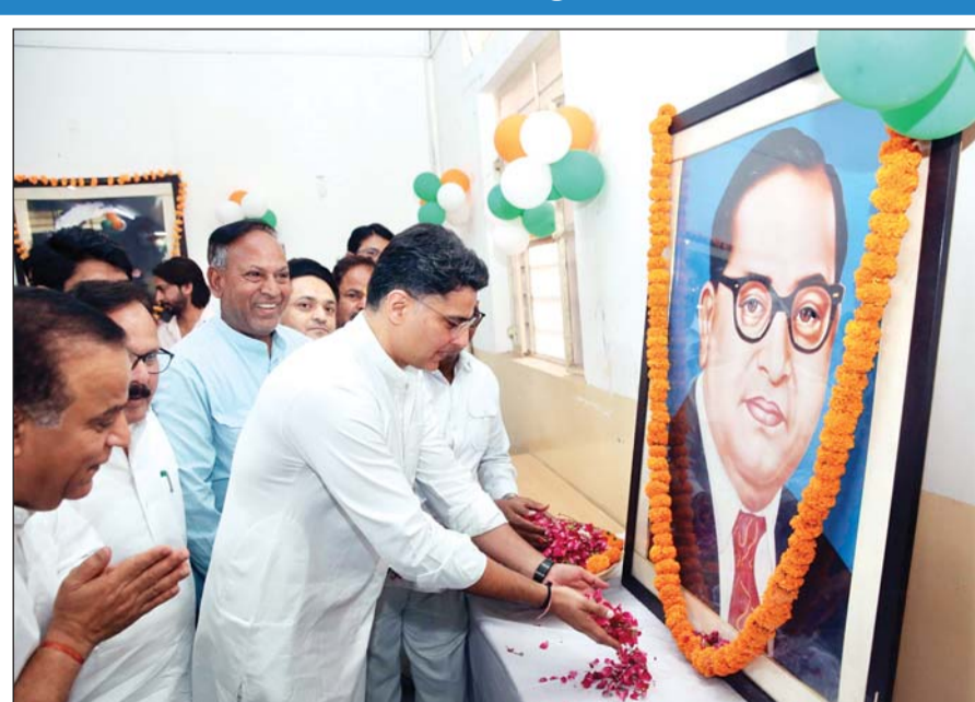
कांग्रेस के राष्ट्रीय महासचिव एवं पूर्व उपमुख्यमंत्री सचिन पायलट मंगलवार को प्रदेश कांग्रेस मुख्यालय में बाबा साहेब की जयंती पर आयोजित पुष्पांजलि कार्यक्रम में शामिल हुए।

जयपुर, 14 अप्रैल (हि.स.)। कांग्रेस के राष्ट्रीय महासचिव एवं पूर्व उपमुख्यमंत्री सचिन पायलट ने कहा कि भीमराव अंबेडकर द्वारा निर्मित संविधान आज भी पूरी तरह प्रासंगिक है और इसकी मूल भावना को रक्षा करना हम सभी का सामूहिक दायित्व है। प्रदेश कांग्रेस मुख्यालय में आयोजित बाबा साहेब की जयंती पर पुष्पांजलि कार्यक्रम में शामिल होने के बाद, मीडिया से बातचीत करते हुए पायलट ने कहा कि वर्तमान समय में कई स्तरों पर संविधान की मूल भावना और प्रावधानों की अनदेखी हो रही है, जो लोकतंत्र के लिए चिंताजनक है। उन्होंने कहा कि जिम्मेदार पदों पर बैठे लोगों को केवल औपचारिक सम्मान तक सीमित न रहकर, संविधान के मूल्यों को व्यवहार में उतारना चाहिए। पायलट ने कहा कि कांग्रेस पार्टी महिलाओं को अधिकार देने के लिए प्रतिबद्ध रही है। उन्होंने बताया कि मनमोहनसिंह सरकार के दौरान सोनिया गांधी के नेतृत्व में महिला आरक्षण विधेयक तैयार किया गया था, लेकिन उस समय यह पारित नहीं हो सका। उन्होंने कहा कि वर्तमान में सरकार इस दिशा में कदम उठा रही है, तो परिसीमन