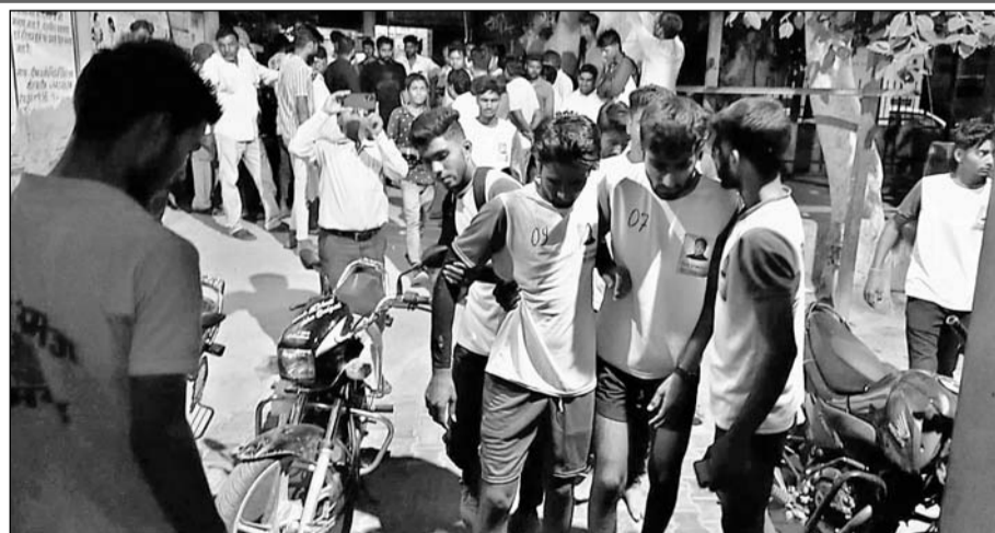
चोटिल खिलाड़ियों को इलाज के लिए रामगढ़ सीएचसी में भर्ती कराया।

अलवर, (निस)। बगड़ राजपूत गांव में आयोजित ब्लाक स्तरीय ग्रामीण ओलंपिक खेल प्रतियोगिता के दौरान खालसा नगर गांव की कबड्डी टीम को विपक्षी नंगला बंजीरका गांव की टीम एवं उसके समर्थकों द्वारा दौड़ा-दौड़ा कर पीटा, घटना में कई खिलाड़ी घायल भी हो गये। लेकिन मौके