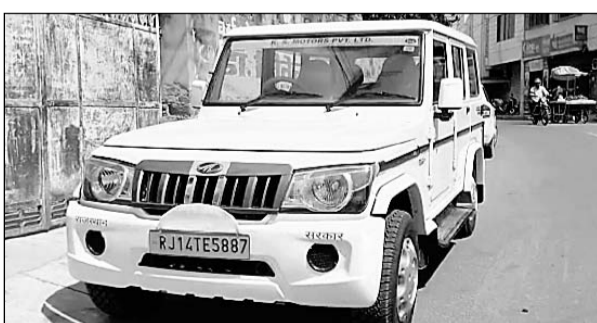
स्टेट जीएसटी की टीम ने एक साथ पांच जगहों पर छाप मारा।

झुंझुनू, (निस)। झुंझुनू में स्टेट जीएसटी जयपुर की टीम ने छापामार कार्रवाई की है। जिसके बाद व्यापारियों में हड़कंप मच गया। मंगलवार सुबह झुंझुनू शहर के तंबाकू उत्पाद व्यवसायी के घर, गोदाम व दुकान समेत पांच ठिकानों पर स्टेट जीएसटी की टीम ने एक साथ छापे मारे।