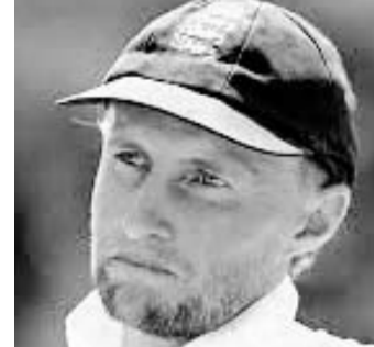
रूट पांच सालों तक इस पद पर बने रहे। उन्होंने इंग्लैंड के लिए 64 टेस्ट मैचों में कप्तानी करते हुए सबसे ज्यादा 27 मैच जीते और 26 हारें। रूट की कप्तानी में इंग्लैंड ने 2018 में भारत के खिलाफ घरेलू टेस्ट श्रृंखला में 4-1 और 2020 में दक्षिण अफ्रीका के खिलाफ 3-1 से जीत दर्ज की थी। 2018 में रूट 2001 के बाद से श्रीलंका में टेस्ट श्रृंखला जीतने वाले इंग्लैंड पुरुष टीम के पहले कप्तान भी बने थे। इस प्रदर्शन को उन्होंने 2021 में फिर से दोहराया, जब इंग्लैंड ने श्रीलंका को 2-0 से कोनरा स्वीप किया था। इंग्लैंड की टीम हालांकि पिछले 17 मैचों में केवल एक ही मैच जीत पाई, जिससे उनके पद पर बادل गंभारने लगे थे। इंग्लैंड के पिछले 14 महीने बहुत मुश्किल रहे, जिसमें भारत के खिलाफ घर पर और घर से बाहर हार, ऑस्ट्रेलिया में 0-4 एंशज हार, टेस्ट

लंदन, 15 अप्रैल। जो रूट ने तत्काल प्रभाव से इंग्लैंड की टेस्ट क्रिकेट टीम के कप्तान पद से इस्तीफा दे दिया है। इंग्लैंड एंड वेल्स क्रिकेट बोर्ड (ईसीबी) ने शुक्रवार को इसकी जानकारी दी। रूट ने हालांकि पुष्टि की है कि वह अंतरराष्ट्रीय क्रिकेट खेलना जारी रखेंगे। उन्होंने कहा कि वह आगे भी अच्छा प्रदर्शन करके टीम की जीत में योगदान देने के लिए उत्साहित हैं। वह आगामी कप्तान, अपने साथियों और कोच की मदद करने के लिए हमेशा तैयार रहेंगे।