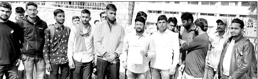
माध्यमिक शिक्षा बोर्ड के बाहर प्रदर्शन करते बेरोजगार एकीकृत महासंघ के युवा।