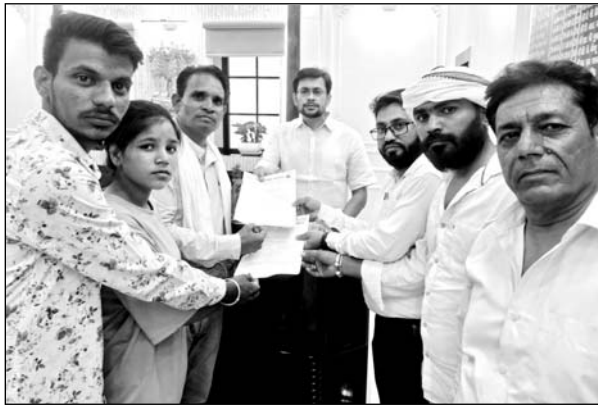
समाज के लोगों ने एसपी व कलेक्टर को ज्ञापन दिया।

मुखर्जी उद्यान में बलाई समाज सहित दलित संगठनों के प्रतिनिधियों ने एक स्वर में आगाह किया कि जिले में बलाई समाज सहित दलित वर्गों पर अत्याचार बढ़े हैं। प्रत्येक थाने में मुकदमे दर्ज होने के बाद भी अभियुक्त गिरफ्तार से दूर हैं। समाज के वक्ताओं ने चेतावनी देते हुए कहा कि समाज को कमजोर न समझें कोई भी अपराधी किसी भी जाति एवं किसी भी दल से जुड़ा हो वह अपराधी होता है और उन्हें कानून सम्मत सजा मिलनी चाहिए। सरकार एवं प्रशासन को चाहिए कि बागौर थाने में