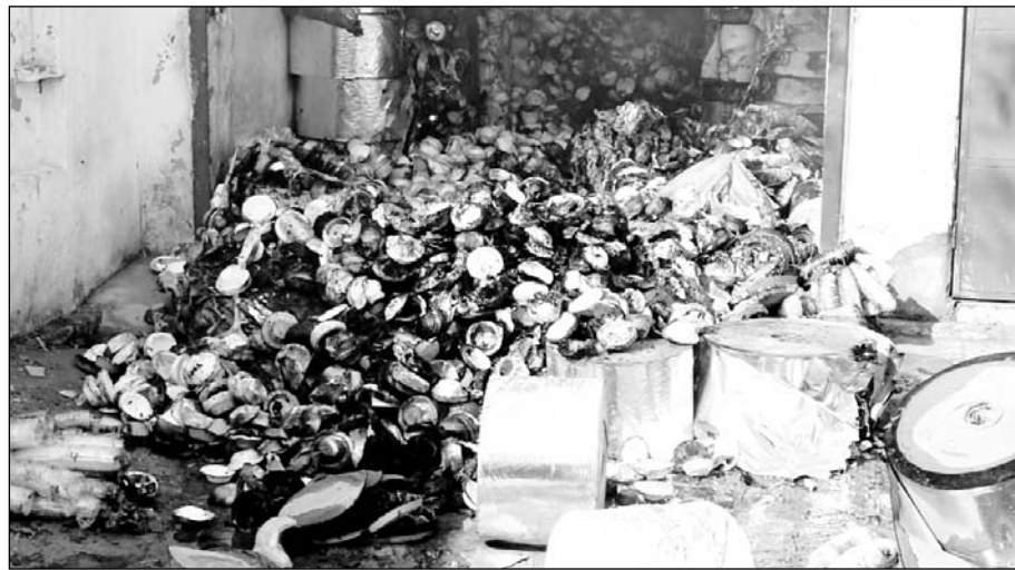
फैक्ट्री में आग लगने से लाखों का माल जल गया।

फुलेरा, (निर्स)। कस्बे की जोबनेर रोड स्थित रीको एरिया में संचालित एक पत्तल-दोना फैक्ट्री में सोमवार को दोपहर करीब दो बजे अचानक आग लग जाने से फैक्ट्री में रखा लाखों रुपए का माल जलकर खाक हो गया। प्राप्त जानकारी के अनुसार फैक्ट्री में आग दोपहर करीब दो बजे लगी। इस दौरान फायर बिटोड की पांच गाड़ियों और पानी के टैंकों के द्वारा आग बुझाने की कोशिश की गई लेकिन आग इतनी भयंकर थी कि उस पर काबू पाना मुश्किल हो गया। आखिर भारी मशकत के बाद करीब 3 घंटे के अन्तराल के बाद आग पर काबू पाया। सूचना पर फुलेरा थाना पुलिस मौके पर पहुंची। हालांकि इस भीषण आग में किसी प्रकार की कोई जनहानि नहीं हुई, लेकिन लाखों रुपये का सामन जलकर खाक हो गया।