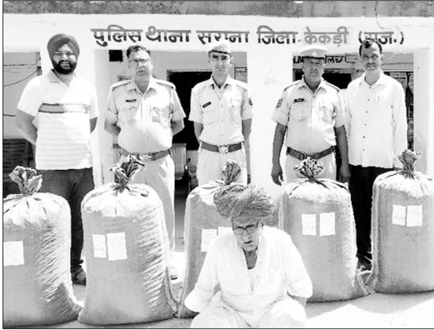
पुलिस ने अवैध डोडा-चूरा सहित एक आरोपी को गिरफ्तार किया।