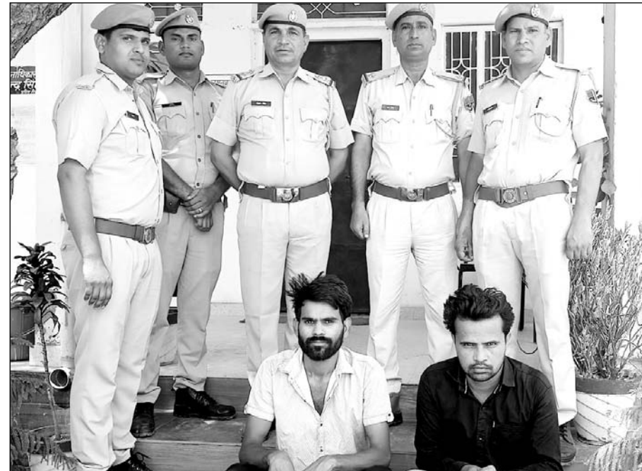
पुलिस ने दो आरोपियों को गिरफ्तार किया।

घटना से आहत होकर पीड़िता ने फांसी लगाकर खुदकुशी कर ली थी