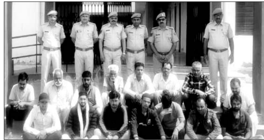
पुलिस ने रविवार को अपराधियों की धरपकड़ अभियान के अंतर्गत विभिन्न मामलों के 12 आरोपियों को गिरफ्तार किया।

बीदासर । पुलिस ने रविवार को अपराधियों की धरपकड़ अभियान के अंतर्गत विभिन्न मामलों के 12 आरोपियों को गिरफ्तार किया।