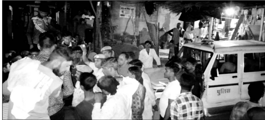
सड़क निर्माण में कोताही के विरोध में सरसड़ी में सड़क पर ग्रामीण एकत्रित हो गये।

ग्रामीणों ने बताया कि इन दिनों सरसड़ी से कर्णई तक करीब 14 करोड़ रुपये की लागत से सड़क निर्माण का कार्य चल रहा है। ठेकेदार द्वारा सड़क निर्माण के दौरान जमकर कोताही बरती जा रही है। जिसके कारण आमजन को परेशानी का सामना करना पड़ रहा है। ग्रामीणों ने बताया कि सड़क निर्माण का कार्य बेहद धीमी गति से किया जा रहा है। ऐसे में इस मार्ग पर यात्रा करने वाले राहगीरों को आवाजाही में परेशानी उठानी पड़ रही है। अचूरे निर्माण कार्य के चलते कई बार हादसे हो चुके हैं।