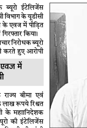
राज्य बीमा व प्रावधानी विभाग में कार्यरत आरोपी वरिष्ठ सहायक गिरफ्तार किया।

■ डेथ क्लेम पास करने के एवज में पीड़ित से रिश्वत मांगी थी