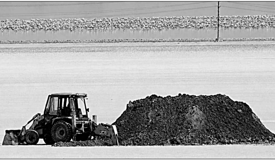
सांभर साल्ट्स लिमिटेड अपने फायदे के लिए कुछ मीटर की दूरी पर ही जेसीबी से खुदाई करवाकर वाटर स्टोरेज के लिए एक बृहद तालाबनुमा गड्ढा तैयार किया जा रहा है।

सांभरझील, (निर्सं)। रामसर साइट में दर्ज विश्व नम भूमि का दर्जा प्राप्त लवणीय झील में वर्तमान में हजारों की तादाद में प्लेमिंगो पक्षियों का इस भीषण गर्मी में भी जमावड़ा इस बात का स्पष्ट सबूत है कि इन परिदों को यहां का वातावरण माफिक आ गया है। शीतकालीन सत्र में हजारों किलोमीटर की यात्रा कर यहां आकर यह अपने