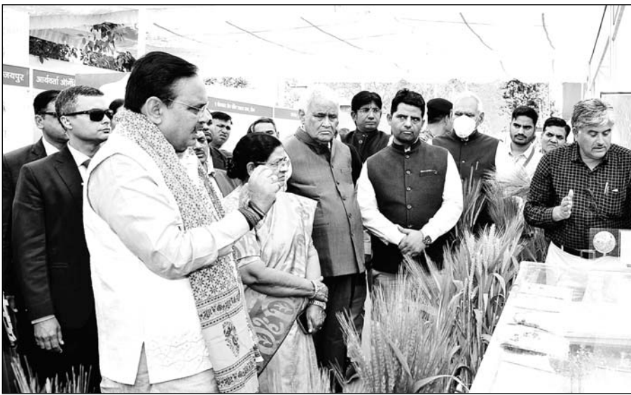
मुख्यमंत्री भजनलाल शर्मा ने राज्य कृषि प्रबंधन संस्थान में सोमवार को कृषि संबंधी विभिन्न विभागों द्वारा लगाई गई स्टॉल एवं प्रदर्शनी का अवलोकन किया।

ध्येय मानकर राज्य सरकार ने नीतिगत निर्णय किए हैं। उन्होंने कहा कि प्रधानमंत्री के किसान कल्याण और उद्यान के संकल्प को पूरा करने में हम कोई कसर नहीं छोड़ेंगे। शर्मा ने प्रधानमंत्री किसान सम्मान निधि के तहत लाभांशित किसानों को बधाई देते हुए कहा कि योजना के तहत आज प्रदेश के 72 लाख से अधिक किसानों के खातों में 1 हजार 400 करोड़ रुपये से अधिक की राशि 19वीं किस्त के रूप में हस्तांतरित की गई है। उन्होंने कहा कि आज का यह समारोह प्रधानमंत्री के किसानों को खुशहाल बनाने के संकल्प और समर्पण की एक मिसाल है। देश को प्रधानमंत्री की गारंटी पर पूरा भरोसा है। शर्मा आज जयपुर के राज्य कृषि प्रबंधन संस्थान में आयोजित राज्य स्तरीय किसान सम्मान समारोह से वीसी के माध्यम से राष्ट्र स्तरीय कार्यक्रम से जुड़े। मुख्यमंत्री ने कहा कि हमने इस बजट में अन्नदाता को संबल देने के लिए किसान सम्मान निधि की राशि को बढ़ाकर 9 हजार रुपये करने की घोषणा की है। अब तक मुख्यमंत्री किसान