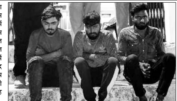
पुलिस ने हत्या के मामले में आरोपियों को गिरफ्तार किया।