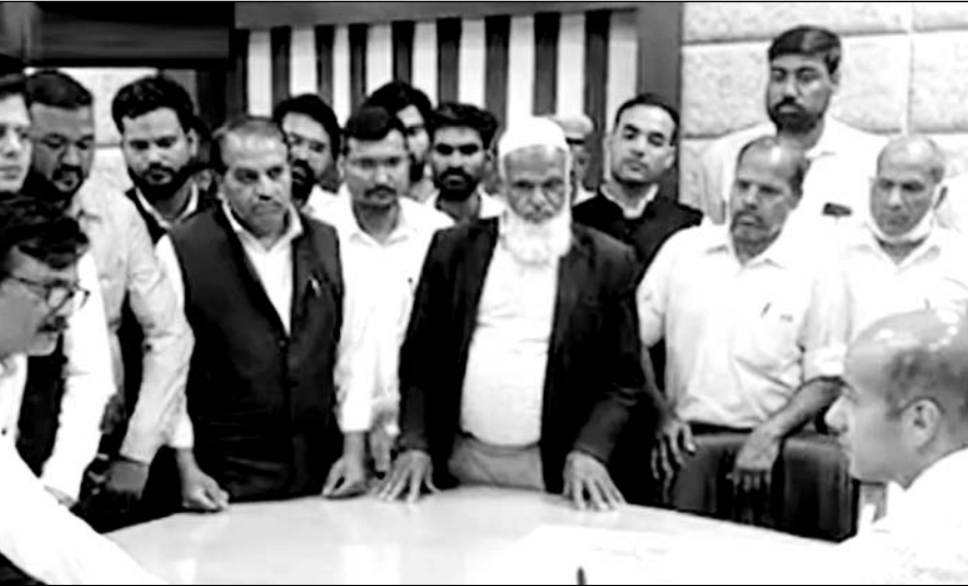
अजमेर में वकीलों ने जिला कलेक्टर को जापन सौंपकर मारपीट करने वालों के खिलाफ कार्यवाही की मांग की।

■ कलेक्टर, एसपी व डीएसओ को सौंपा जापन, ढाबा संचालक के खिलाफ कार्रवाई की मांग