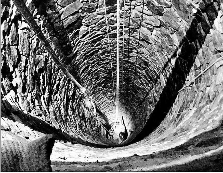
रूपनगढ़ : एसडीआरएफ टीम ने स्ट्रेचर पर बांध कर कुएं से महिला के शव को बाहर निकाला।