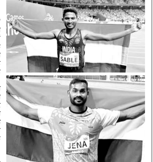
में 75.49 मीटर का श्रो लगाया था। मौजूदा ओलंपिक और विश्व चैंपियन भाला फेंक एथलीट नीरज चोपड़ा में जांच की समस्या के कारण इस प्रतियोगिता में नहीं खेलने का फैसला किया था।

पेरिस, 8 जुलाई। अविनाश साबले ने रविवार को पेरिस में डायमंड लीग प्रतियोगिता में आठ मिनट 9.91 सेकेंड का समय निकालकर छठे स्थान पर रहकर 3000 मीटर स्टीपलचेस में अपना ही राष्ट्रीय रिकॉर्ड तोड़कर दिखाया कि वह पेरिस ओलंपिक से पहले से पहली सही समय पर लय में आ रहे हैं। 29 वर्षीय साबले ने 8:11.20 सेकेंड का अपना पिछला राष्ट्रीय रिकॉर्ड तोड़ दिया जो उन्होंने 2022 में बनाया था। इस तरह उन्होंने डेड सेकेंड से बेहतर समय निकाला। इथियोपिया के अब्राहम सिसिमे 8:02.36 के समय से कोनिया के अमोस सेरेम (8:02.36) से 'फोटो फिनिश' में पहले स्थान रहे। कोनिया के अब्राहम किबिबोट 8:06.70 के समय से तीसरे स्थान पर रहे। साबले ने दो साल पहले बर्लिन में 2022 राष्ट्रमंडल खेलों में रजत पदक जीतकर राष्ट्रीय रिकॉर्ड बनाया था और वह इसे तोड़ने में सफल रहे। यह उनका 10वां राष्ट्रीय रिकॉर्ड तोड़ने वाला प्रदर्शन रहा। वहीं पुरुषों की भाला फेंक स्पर्धा में ओलंपिक दल के सदस्य किशोर जेना का संघर्ष जारी रहा और वह 78.10 मीटर के प्रयास से आठवें स्थान पर रहे। उनका सर्वश्रेष्ठ प्रदर्शन 87.54 मीटर है और सत्र का सर्वश्रेष्ठ प्रदर्शन 80.84 मीटर है। पिछले साल एशियाई खेलों में रजत पदक जीतने वाले जेना का इस सत्र में प्रदर्शन अच्छा नहीं रहा है। उन्होंने दोहा डायमंड लीग में 76.31 मीटर और फेडरेशन कप