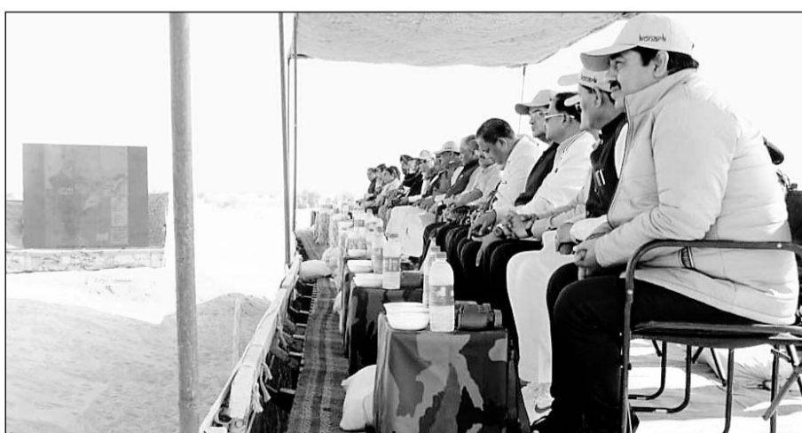
रक्षा संबंधी स्थायी समिति के संसद सदस्यों ने जैसलमेर फील्ड फायरिंग रेंज में शक्ति प्रदर्शन देखा।