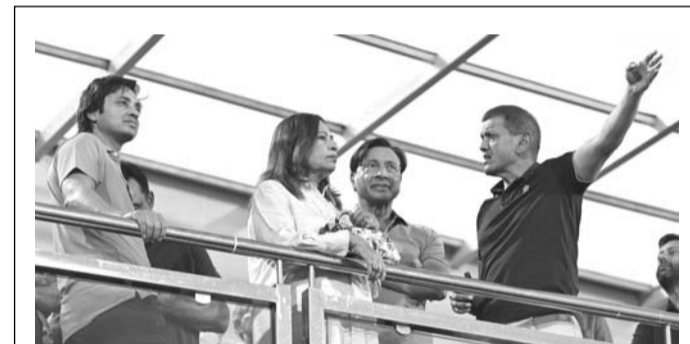
राजस्थान रॉयल के नए मालिक लक्ष्मी निवास मित्तल ने बेटे के साथ एसएमएस स्टेडियम पर टीम को अभ्यास करते देखा।

जीतने के लिए अपनी टीम में बड़े बदलाव कर सकती है। रिपोर्ट में यह भी कहा गया है कि सूर्यकुमार यादव का बल्ले से खराब प्रदर्शन भारत के अगले टी20 कप्तान के रूप में उनकी भूमिका में बदलाव का एक प्रमुख कारण हो सकता है। उन्होंने टी20 विश्व कप में नौ पारियों में 242 रन बनाए, जिनमें से 84 रन उन्होंने अमेरिका के खिलाफ बनाए थे। भारतीय कप्तान मौजूदा आईपीएल (इंडियन प्रीमियर लीग) 2026 में मुंबई इंडियंस के लिए भी संघर्ष कर रहे हैं, जहां पांच बार की चैंपियन टीम अंक तालिका में नौवें स्थान पर है।