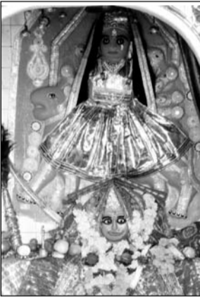
गुगोर स्थित बीजासन माता।

छबड़ा, (निसं)। कस्बे से आठ किलोमीटर दूर राजस्थान एवं मध्यप्रदेश की सीमा पर गांव गुगोर स्थित मां बीजासन मंदिर दोनों राज्यों के भक्तों का आस्था का केंद्र है। यूँ तो कस्बे सहित जिलेभर में कई धार्मिक स्थल हैं, लेकिन बीजासन माता मंदिर प्रमुख धार्मिक स्थल है। भक्त यहाँ सच्ची श्रद्धा से जो भी मन्त्र मांगते हैं, ही श्रद्धालुओं का मानना है कि प्राचीन समय में बीजासन माता यहां से नाराज होकर चमत्कारिक रूप से पार्वती नदी के तट पर प्रकट हुई थी। श्रद्धालुओं ने जन सहयोग से यहां माता की मूर्ति की प्राण प्रतिष्ठा कर मंदिर निर्माण कराया था। तब से ही यहां राजस्थान ही नहीं