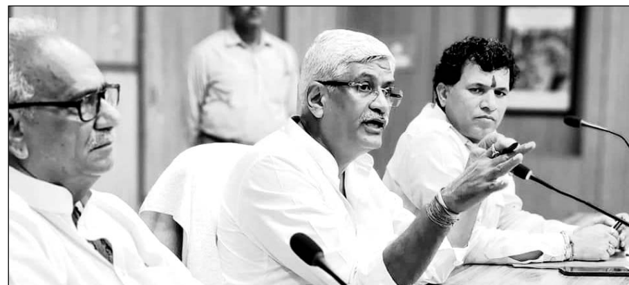
जोधपुर के डीआरडीए हॉल में मंत्रियों ने लंपी स्कीन बीमारी को लेकर जानकारी ली।

रविवार को बैठक के बाद मीडिया के साथ अनौपचारिक बातचीत में केन्द्रीय मंत्री शेखावत ने कहा कि गुजरात के रास्ते से आकर पिछले दो महीने में पश्चिमी राजस्थान के लगभग सभी जिलों में लंपी वायरस कहर बरपा है। हजारों गायों की मौत हो चुकी है। यदि पश्चिमी राजस्थान का आंकड़ा उठाकर देखें तो लगभग एक लाख से ज्यादा पशुधन इससे संक्रमित