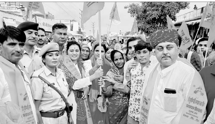
डिग्गी मेले के समापन अवसर पर पदयात्रा का शाही ध्वज मंदिर शिखर पर चढ़ाया गया।