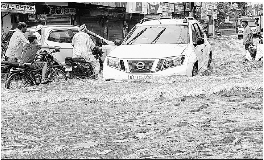
बारिश के बाद दर्जनों दुकानों और शहर के निचले इलाकों में पानी भर गया।