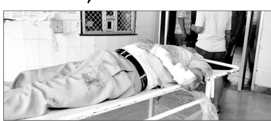
घायलों का रिंगस सीएचसी में उपचार किया गया।

रिंगस, (निस)। खाटूश्यामजी के दर्शनों के लिए नोएडा से आ रही एक बस राजमार्ग पर दूसरे वाहन के साइड दबावे से बचने के प्रयास में पलट गई।