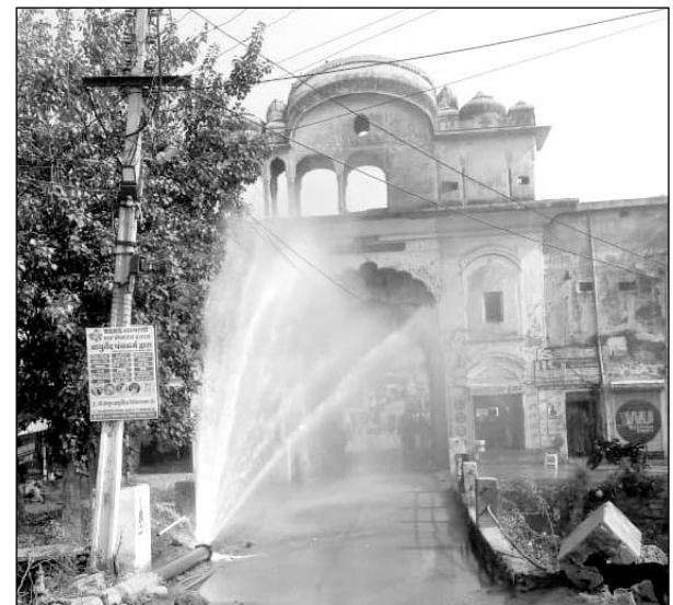
पानी सप्लाई शुरू होने पर ऊपर तक पानी का फव्वारा निकलता है।