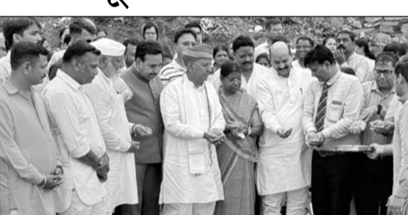
सांसद भागीरथ चौधरी व विधायक अनिता भदेल ने भूमि पूजन कार्य निर्माण कार्य का किया शुभारंभ।

अजमेर,(कास)। अजमेर दक्षिण विधानसभा क्षेत्र में चन्द्रवरदायी नगर योजना में 7 करोड़ रुपये की लागत से बनने वाले जीएनएम नर्सिंग विद्यालय का भव्य शिलान्यास किया गया। इस अवसर पर केंद्रीय कृषि एवं किसान कल्याण राज्य मंत्री और लोकसभा सांसद भागीरथ चौधरी तथा अजमेर दक्षिण विधायक अनिता भदेल की उपस्थिति में भूमि पूजन कर निर्माण कार्य का शुभारंभ किया गया। कार्यक्रम में संबोधित करते हुए भागीरथ चौधरी ने कहा कि अनिता भदेल के सतत प्रयासों और संघर्ष के कारण क्षेत्र को यह महत्वपूर्ण सौभाग्य मिली है। उन्होंने कहा कि भारत प्रतिभाओं का देश है और इन प्रतिभाओं को निखारने के लिए बेहतर सुविधाएं और अवसर प्रदान करना आवश्यक है। चिकित्सा क्षेत्र में युवाओं को आगे बढ़ने के लिए प्रोत्साहित किया जाना चाहिए, जिससे आमजन को बेहतर स्वास्थ्य सेवाएं मिल सकें। उन्होंने कहा कि इस नर्सिंग विद्यालय