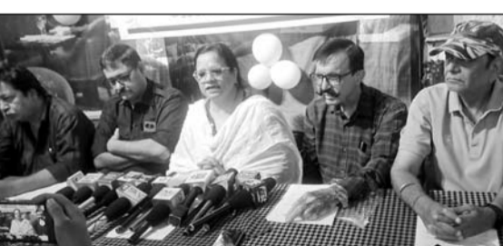
'संगीत के रंग एमएसएमटी के संग' कार्यक्रम से पूर्व हुई प्रेस वार्ता।