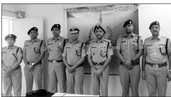
रेंज आईजी कार्यालय में गार्ड ऑफ ऑनर से हुआ स्वागत।