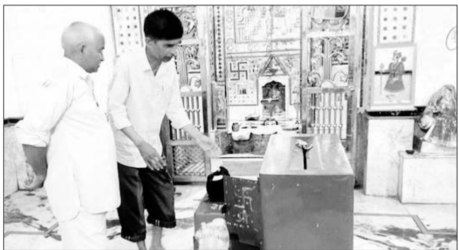
आसपुर क्षेत्र के कतिसौर स्थित कटकेश्वर महादेव में चोरी के बाद पुजारी ने जानकारी दी।

डूंगरपुर, (नि.सं.)। आसपुर पुलिस थाना क्षेत्र के कतिसौर कस्बे में स्थित कटकेश्वर महादेव मंदिर के दसवीं बार शुकुवार फिर ताले टूटे, लेकिन इस बार दानपेटी के ताले नहीं टूटने से चोरी को अंजाम नहीं दे सके।