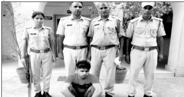
पुलिस की गिरफ्तार में आरोपी।