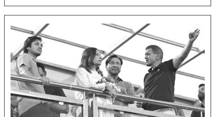
राजस्थान रॉयल के नए मालिक लक्ष्मी निवास मित्तल ने बेटे के साथ एसएमएस स्टेडियम पर टीम को अभ्यास करते देखा।