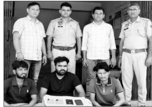
जामडोली थाना पुलिस ने फ्लिपकार्ट की डिलीवरी में महंगे सामान चुराने वाले बदमाशों को गिरफ्तार किया।

-कार्यालय संवाददाता- जयपुर। राजधानी में ऑनलाइन शॉपिंग कंपनियों और डिलीवरी नेटवर्क को निशाना बनाकर महंगे मोबाइल और इलेक्ट्रॉनिक सामान हड़पने वाले एक हाईटेक गिरोह का जामडोली थाना पुलिस ने पर्दाफाश किया है। पुलिस ने फ्लिपकार्ट से महंगे आईफोन, एंड्रॉयड फोन और आईपैड