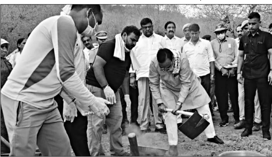
मुख्यमंत्री भजनलाल शर्मा ने शुक्रवार को नींदड वन क्षेत्र में बंदे गंगा जल संरक्षण-जन अभियान के तहत एनिकट पर श्रमदान किया।

जयपुर (कास)। मुख्यमंत्री भजनलाल शर्मा ने शुक्रवार को नींदड वन क्षेत्र में नींदड-बैनाड बायोडाइवर्सिटी प्रोजेक्ट ईको ट्रेल का उद्घाटन किया। इस अवसर पर उन्होंने बंदे गंगा जल संरक्षण-जन अभियान के तहत एनिकट पर श्रमदान कर आमजन से जल संरचनाओं के संरक्षण एवं संवर्धन में सहभागिता निभाने का आह्वाण किया।