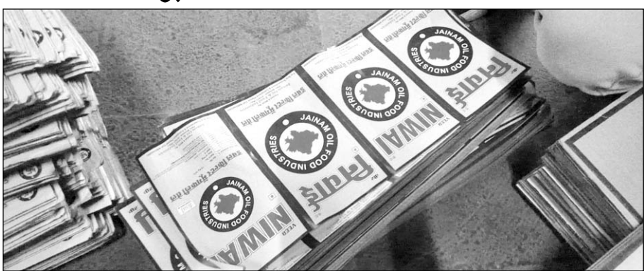
कंपनी के प्रतिनिधि की शिकायत पर पुलिस ने कार्रवाई कर रैपर और अन्य सामान मौके से जप्त किया।