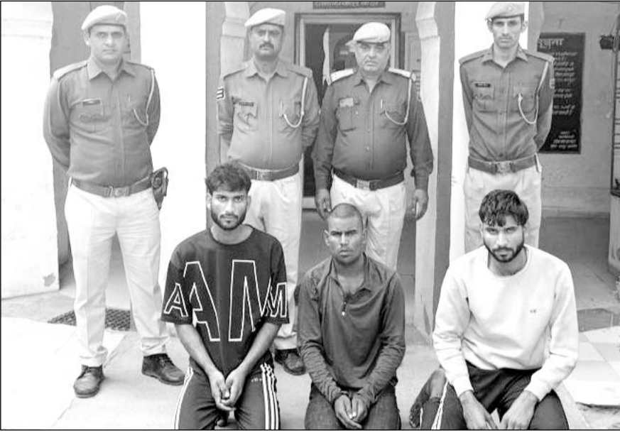
प्रागपुरा थाना पुलिस ने नकबजनी गैंग के तीन आरोपियों को गिरफ्तार किया।