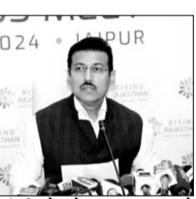
डूंग्र विजनेस' के तहत व्यवसाय करने की लागत में कमी लाना और लावफोताशाही को कम करने का निरंतर प्रयास कर रही है, ताकि उद्योग जगत को प्रदेश में काम करने में आसानी हो।

जयपुर। मुख्यमंत्री भजन लाल शर्मा के नेतृत्व में इस वर्ष दिसंबर में जयपुर में आयोजित होने वाले 'राइजिंग राजस्थान' ग्लोबल इन्वेस्टमेंट समिट 2024 से पहले उद्योग एवं वाणिज्य मंत्री कर्नल राज्यवर्धन राठौड़ ने आज मीडिया को संबोधित किया। आज आयोजित प्रेस कॉन्फ्रेंस में माननीय मंत्री कर्नल राठौड़ ने कहा कि सरकार अगले पांच वर्षों में राज्य के सकल घरेलू उत्पाद को मौजूदा 15 लाख करोड़ रुपये से दोगुना करके 30 लाख करोड़ रुपये तक पहुंचाने का लक्ष्य लेकर चल रही है और 'राइजिंग राजस्थान' ग्लोबल इन्वेस्टमेंट समिट 2024 के जरिए प्रदेश में निवेश जुटाना सरकार की सर्वोच्च प्राथमिकता है। कर्नल राठौड़ ने यह भी कहा कि सरकार 'इज ऑफ