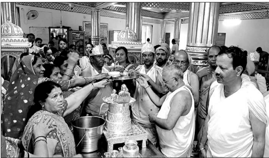
बांसवाड़ा के बाहुबली कॉलोनी स्थित मुनिस्वत मंदिर में शांतिधारा का लाभ लेते श्रद्धालु।