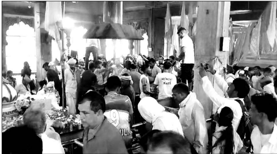
बाबा भर्तृहरिनाथ के मेले में पहुंचे श्रद्धालुओं ने मन्नत मांगी।

हर साल भाद्र पक्ष की अष्टमी के दिन यहां लक्ष्मी मेले का आयोजन किया जाता है जिससे माधोगढ़ ग्राम पंचायत द्वारा आयोजित कवाया जाता है। यहां पर उल्लेखनीय है कि बाबा भर्तृहरि का मेला सधन जंगल में आयोजित होता है और लाखों की संख्या में भक्त पहुंचते हैं लेकिन जिला प्रशासन और पुलिस की सूझबूझ के चलते अपराधी मेले में कम ही पहुंचते हैं, फिर भी छुटपुट