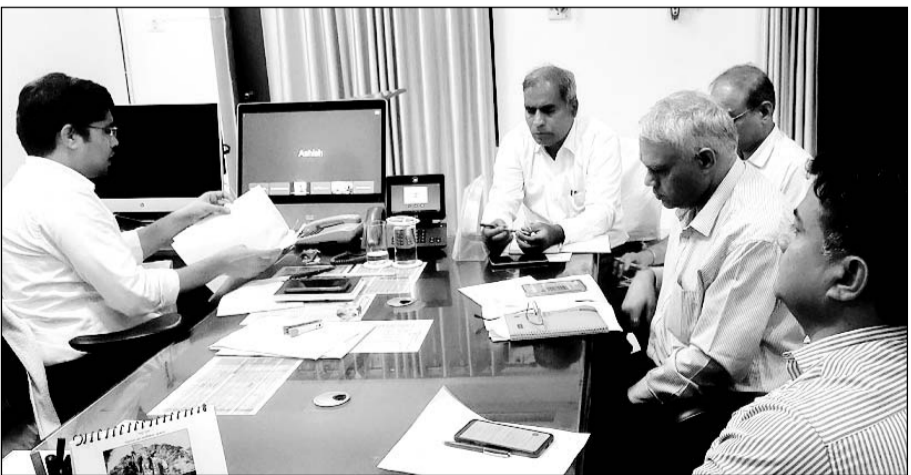
जल महोत्सव के आयोजन को लेकर बैठक में निर्देश देते जिला कलक्टर डॉ. इन्द्रजीत यादव।

बांसवाड़ा, (निर्स)। जल महोत्सव के आयोजन को लेकर जिला कलक्टर डॉ. इन्द्रजीत यादव ने बैठक लेते हुए आयोजन संबंधी तैयारियां सुनिश्चित करने के निर्देश दिये। जलझूलनी एकादशी पर सभी बांध व जलाशयों पर महोत्सव मनाया जाएगा। जल महोत्सव में काश्तकारों, आमजन, पशुधन व औद्योगिक आदि को जोडा जाएगा महोत्सव के तहत जलाशयों पर सांस्कृतिक कार्यक्रम आयोजित होंगे।