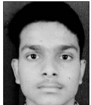
मृतक चचेरे भाई।