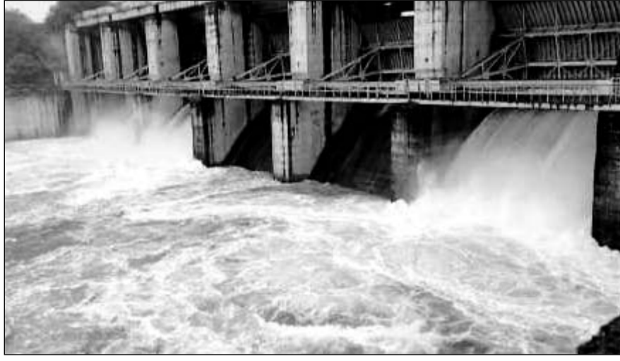
करौली जिले के सबसे बड़े बांध पांचना से पानी की निकासी की जा रही है।