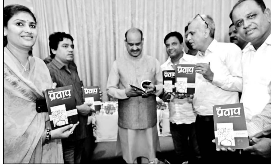
पुस्तक प्रणवीर प्रताप का लोकसभा अध्यक्ष ओम बिरला ने विमोचन किया।

पुस्तक की भाषा हिंदी, अंग्रेजी तथा राजस्थानी होने से यह सभी वर्ग के लिए सरल रूप में उपलब्ध है। इसमें महाराणा प्रताप के परिवार की, संघर्ष के दौरान सहयोग भूमिका पर प्रकाश