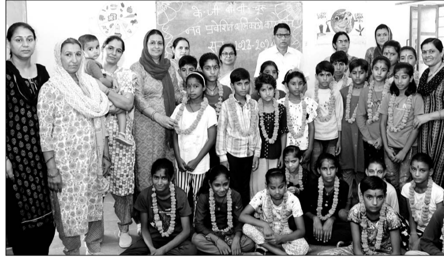
कस्तूरबा गांधी बालिका आवासीय विद्यालय में नव प्रवेशित बालिकाओं का स्वागत व पौधरोपण कार्यक्रम आयोजित किया गया।