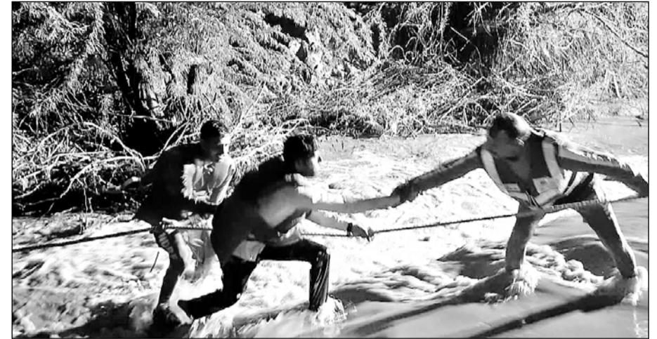
जालोर के निकट धुम्बडिया स्थित सुकड़ी नदी में फंसे लोगों को एनडीआरएफ की टीम ने बाहर निकाला।

कार से माउंट आबू घूमकर लौट रहे थे सिणधरी निवासी पांच व्यक्ति