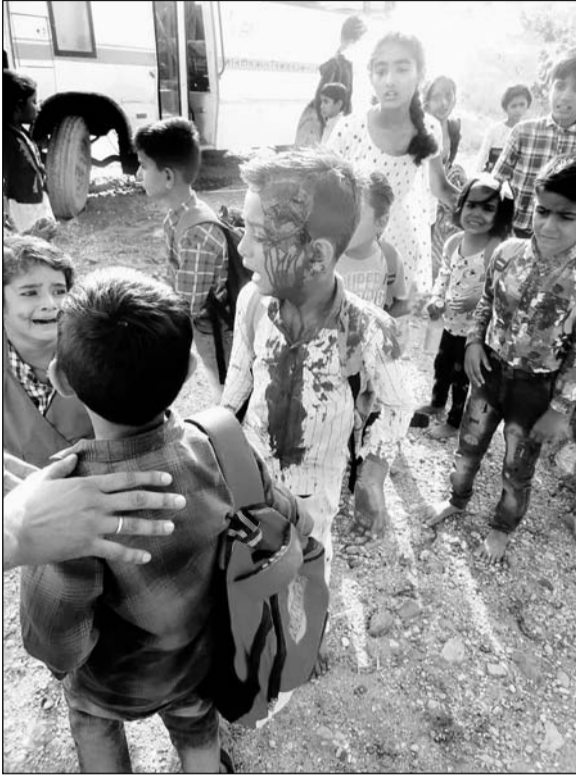
स्कूल बस पलटने के बाद घायल बच्चों में चीख-पुकार मच गई।