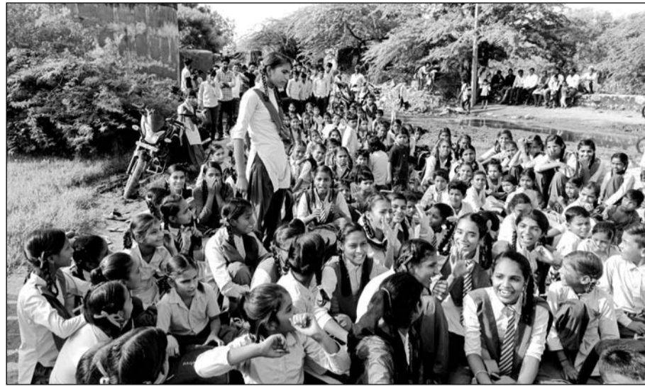
छात्राओं ने अध्यापकों की कमी को लेकर प्रदर्शन किया।

अध्यापकों की कमी के कारण पढ़ाई नहीं होने से ग्रामीण व अभिभावक भड़क गये