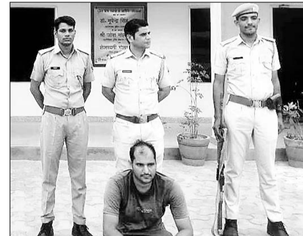
पुलिस ने अवैध शराब सहित आरोपी को गिरफ्तार किया।