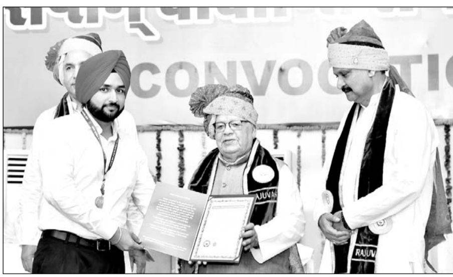
बीकानेर के वेटनरी विश्वविद्यालय के दीक्षांत समारोह में राज्यपाल कलराज मिश्र ने स्वर्ण पदक व उपाधियां प्रदान कीं।

राज्यपाल ने कहा कि बढ़ती जनसंख्या घटती कृषि जोत पानी तथा अन्य प्राकृतिक संसाधनों की कमी मनुष्य के लिए एक बड़ी चुनौती है। ऐसे में पशुधन और पशु उत्पाद ही पोषण सुरक्षा की दृष्टि से वरदान साबित हो सकते हैं। इसके लिए खाद्य और दूध उद्योग में छोटे और मध्यम उद्यमों को बढ़ावा देने की आवश्यकता है। राज्यपाल मिश्र ने कहा कि राजुवास तीन संघटक पशु चिकित्सा विज्ञान महाविद्यालयों एक डेयरी एवं खाद्य प्रौद्योगिकी महाविद्यालय आठ सम्बद्ध महाविद्यालयों तथा 101 डिप्लोमा संस्थानों के माध्यम से प्रदेश में पशु चिकित्सा शिक्षा अनुसंधान एवं प्रसार के क्षेत्र में सराहनीय कार्य कर रहा है। ऐसे में विश्वविद्यालय प्रसार शिक्षण के