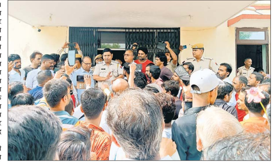
कांवड़ियों के साथ पुलिस मारपीट के विरोध में सोमवार को हिन्दू संगठनों ने सांभर थाने के आगे जमा होकर विरोध प्रदर्शन किया।

इन दिनों, जब राहुल बोलते हैं तो वे रुकते तो है ही नहीं, जब वे विभिन्न मुद्दों पर मोदी सरकार को टक्कर देते हैं, उस समय वे काफी मजेदार बातें भी बोल देते हैं। उन्होंने कहा कि इस बजट ने मध्यम वर्ग के सीने तथा पीठ में छुरा भौंका है। उन्हीं कहा कि यही मध्यम वर्ग