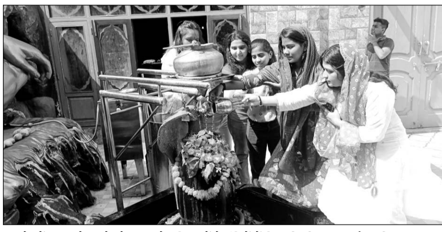
अजमेर में सावन के दूसरे सोमवार को महिलाओं ने मंदिरों में शिवजी की पूजा-अर्चना की।