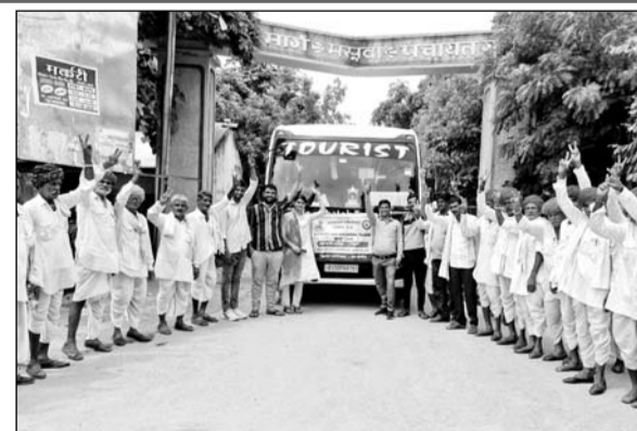
दल को हरी झंडी दिखाकर रवाना किया।