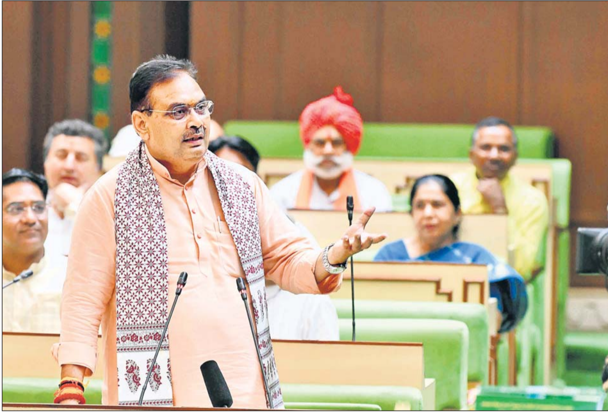
मुख्यमंत्री भजनलाल शर्मा ने सोमवार को विधानसभा में बजट पर बहस एवं चर्चा का जवाब पेश किया।