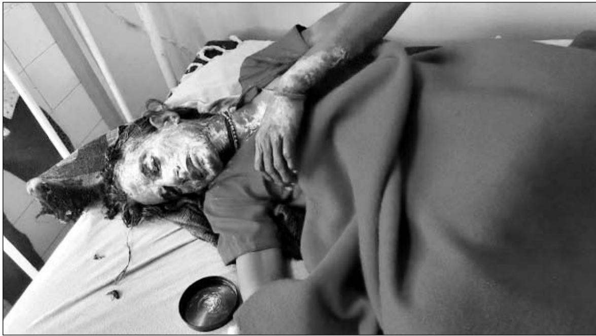
एसिड अटैक में घायल महिला का अस्पताल में उपचार जारी है।