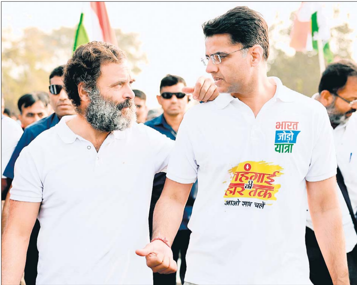
राजस्थान के नेताओं में सचिन पायलट लगातार राहुल गांधी के साथ पैदल चल रहे हैं और इस दौरान दोनों में लगातार चर्चा भी हो रही है। दूसरे दिन की यात्रा के दौरान राहुल गांधी सचिन पायलट के कंधे पर हाथ रखकर काफी देर तक चर्चा करते हुए नजर आए।