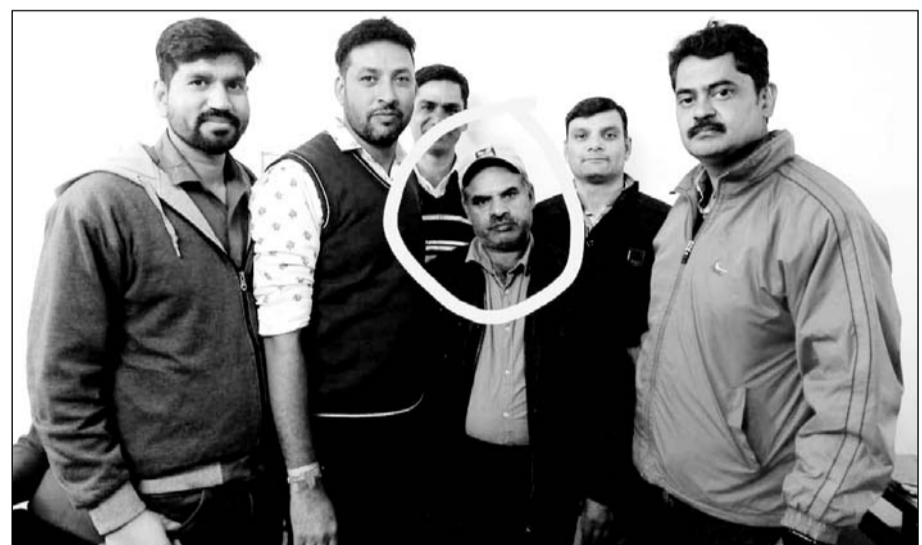
एसीबी की उदयपुर यूनिट ने आरोपी (गोल घेरे में) को गिरफ्तार किया।