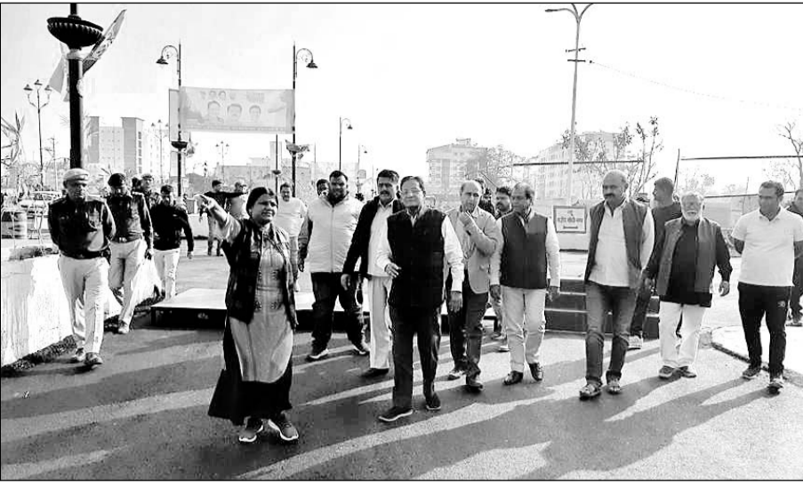
कोटा में यूडीएच मंत्री शांति धारीवाल लगातार भारत जोड़ो यात्रा की तैयारियों का जायजा ले रहे हैं।

कोटा, (निर्स)। राहुल गांधी की भारत जोड़ो यात्रा के कोटा शहर प्रवेश का काउंटडाउन शुरू हो गया है, भारत जोड़ो यात्रा के स्वागत को लेकर तैयारियां पूर्ण कर ली गई हैं। नगरीय विकास एवं स्वागत शासन मंत्री शांति धारीवाल ने मंगलवार को यात्रा के कोटा में प्रवेश से लेकर भव्य स्वागत सहित सभी व्यवस्थाओं का जायजा लेकर कहा कि भारत जोड़ो यात्रा के स्वागत को लेकर कांग्रेसजन में जो उत्साह देखा जा रहा है ऐसा उत्साह मैंने पहले कभी नहीं देखा हर कांग्रेस कार्यकर्ता यात्रा में शामिल होने और यात्रा का स्वागत करने के लिए उत्साहित है। कोचिंग सिटी कोटा में भारत जोड़ो यात्रा का भव्य स्वागत होगा।