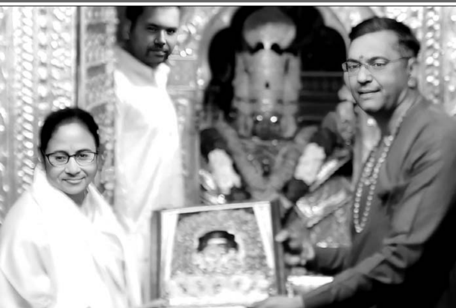
पुष्कर में ब्रह्मा मंदिर में दर्शन करने के बाद मंहत ने मुख्यमंत्री ममता बनर्जी को स्मृति चिन्ह भेंट किया।

अजमेर/ पुष्कर/ मदनगंज, (कासं)। पश्चिम बंगाल की मुख्यमंत्री ममता बनर्जी अपने एक दिवसवसी दौर पर मंगलवार सुबह अजमेर पहुंचीं। सीएम बनर्जी को कड़ी सुरक्षा के बीच उन्हें किशनगढ़ एयरपोर्ट से अजमेर लाया गया। बनर्जी ने सूफी संत ख्वाजा साहब की दरगाह में सूफी परंपरा के अनुरूप दरगाह जियारत कर अकीदत के फूल और मखमली चादर पेश कर देश में अमन, चैन और खुशहाली की दुआ मांगी। इसके बाद बनर्जी पुष्कर पहुंचीं, जहां उन्होंने पुष्कर सरोवर में पूजा अर्चना कर ब्रह्मा मंदिर में दर्शन किए। पश्चिम बंगाल की मुख्यमंत्री ममता बनर्जी ने अजमेर और राजस्थान की मीडिया से पूरी तरह से दूरी बनाए रखी और केवल पश्चिम बंगाल से आए मीडिया कर्मी से ही बातचीत की।