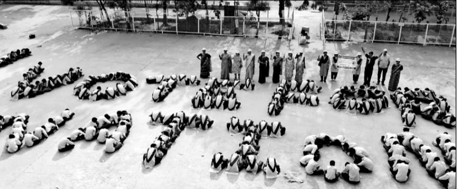
राजकीय उच्च माध्यमिक विद्यालय, सुभाष नगर में बालक बालिकाओं द्वारा श्रृंखला बनाकर “वोट फॉर नेशन” का संदेश दिया गया।

एक हजार छात्र-छात्राओं ने मैदान में छात्र श्रृंखला बनाई