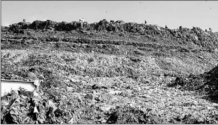
हरमाड़ा के नजदीक सेवापुरा डंपिंग यार्ड पर लगा हुआ कचरे का पहाड़।