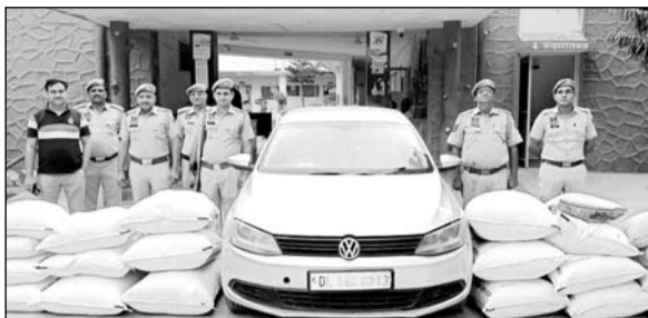
सांगानेर सदर पुलिस ने रविवार को 200 किलो अवैध मादक पदार्थ डोडा-चूरा और कार के साथ शांति बदमाश को गिरफ्तार किया।

सी.एस.टी. टीम ने 55 किलो 260 ग्राम गांजे के साथ तस्कर दबोचा