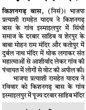
गांव-गांव में हुआ स्वागत, लोगों से मांगे वोट