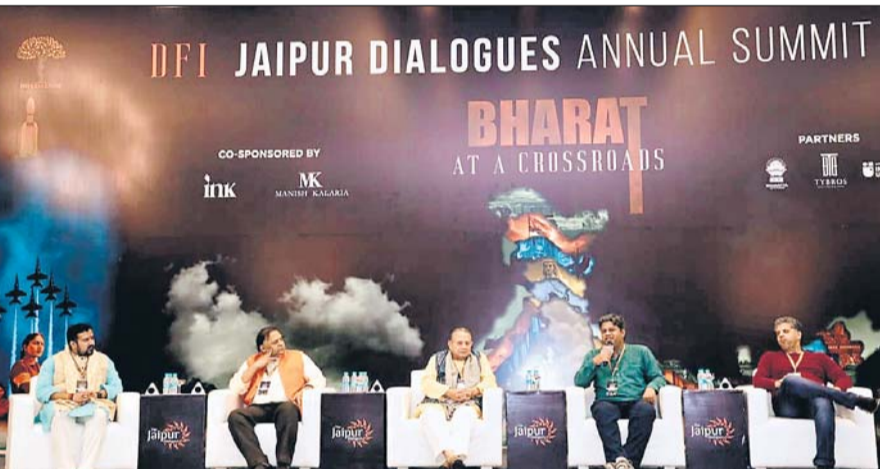
'जयपुर डायलाग्स' के रविवार को अंतिम दिन साहित्यकारों ने विभिन्न सत्रों में राष्ट्रधर्म, सभ्यता, भारतीय शिक्षा नीति, भू-राजनीति आदि कई मुद्दों पर चर्चा की।