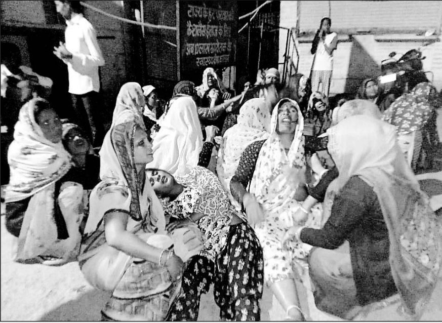
हादसे के सूचना मिलने पर परिवारजन बिलख पड़े और महिलाओं में कोहराम मच गया।