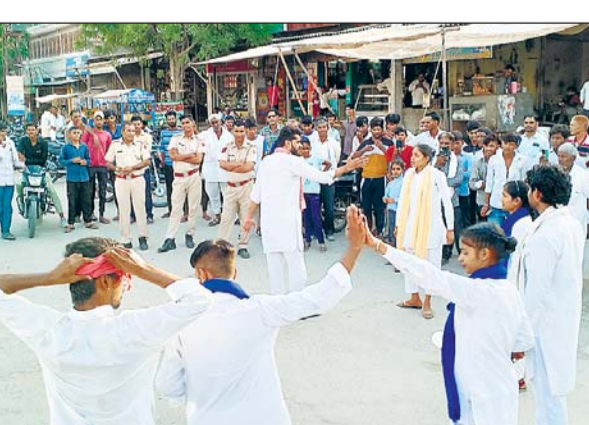
जिला प्रशासन एवं कम्प्यूनिटी थिएटर टोंक द्वारा मतदान जागरूकता के लिए नुकड़ नाटक के मंचन किए जा रहे हैं।

समूह द्वारा प्रस्तुत इस नुकड़ नाटक का मुख्य उद्देश्य है कि लोकतंत्र में मतदान हमारा मौलिक अधिकार है। लोकतंत्र की जड़ मजबूत बनाने के लिए समाज के सभी वर्गों के सभी सदस्यों को अपनी सामाजिक जिम्मेदारी अदा करना हमारा दायित्व है। मतदान भारतीय लोकतंत्र का सबसे महत्वपूर्ण पर्व है जिसमें सभी लोगों की भागीदारी अहम है। इस दिशा में कम्प्यूनिटी थिएटर टोंक मतदान एवं सामाजिक सौहार्द जागरूकता अभियान में स्वैच्छिक भागीदारी ले रहा है। मतदान एवं सामाजिक सौहार्द को बढ़ाने के लिए जन जागरण की दिशा में स्थानीय मोहल्लों में प्रभात फेरियां और नुकड़ नाटक का आयोजन कर रही है। जिसमें कम्प्यूनिटी थिएटर टोंक के कलाकारों