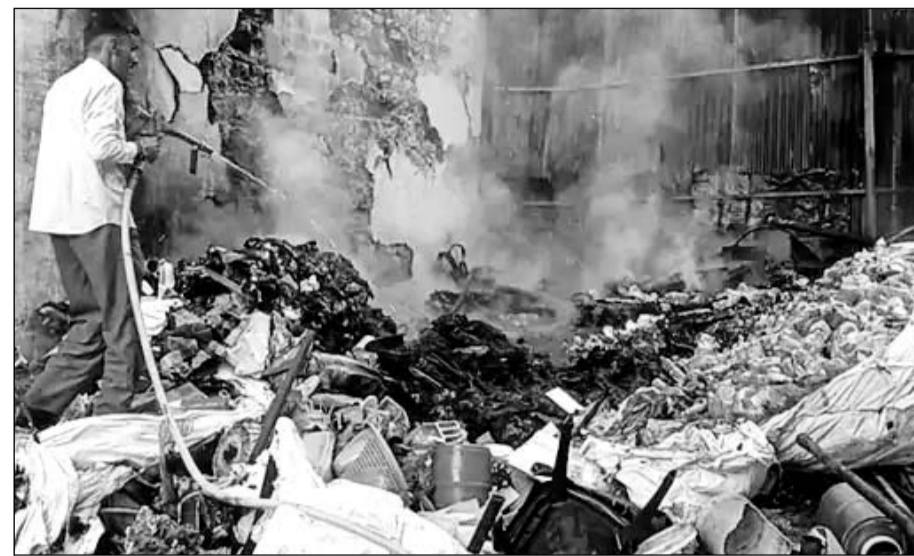
गंगापुर सिटी में कबाड़ के गोदाम में लगी आग दमकलकर्मियों ने बुझाई।