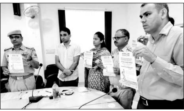
पुलिस लाइन सभागार में एक दिवसीय कार्यशाला आयोजित हुई।