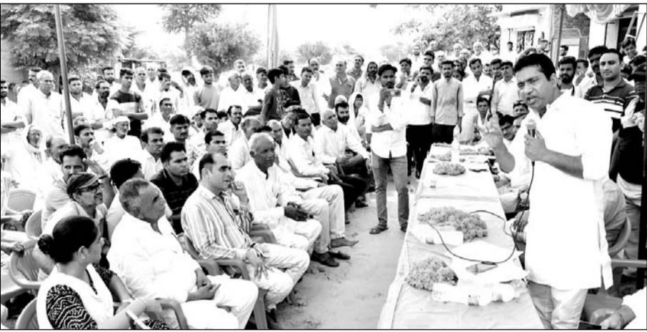
गांव जसरासर में प्रधानमंत्री ग्राम सड़क योजना के अन्तर्गत बनने वाली जसरासर से नाकरासर, जासासर व धीरासर सड़क का शिलान्यास नेता प्रतिपक्ष राजेन्द्र राठौड़ व सांसद राहुल कस्वां ने समारोहपूर्वक किया।

चूरु, (कांस)। गांव जसरासर में प्रधानमंत्री ग्राम सड़क योजना के अन्तर्गत 1098.70 लाख की लागत से बनने वाली जसरासर से नाकरासर, जासासर व धीरासर सड़क का शिलान्यास नेता प्रतिपक्ष राजेन्द्र राठौड़ व सांसद राहुल कस्वां ने रविवार को किया। इस अवसर पर नेता प्रतिपक्ष राजेन्द्र राठौड़ ने कहा कि विकास का दूसरा नाम भाजपा है। भाजपा के शासनकाल में प्रदेश का चहुँमुखी विकास हुआ है। जब से प्रदेश में कांग्रेस की सरकार बनी है तब से ही प्रदेश में विकास रुक गया है। उन्होंने ग्रामीण विकास की बात करते हुये कहा कि जब उनके पास ग्रामीण विकास मंत्रालय था, उस समय ग्रामीण क्षेत्रों में चहुँमुखी विकास किया गया था। परंतु अब ग्रामीण क्षेत्रों में विकास का काम देखने को नहीं मिलता। उन्होंने कहा कि आने वाले चुनाव में प्रदेश की ग्रामीण जनता कांग्रेस को सबक सिखायेगी। कार्यक्रम को संबोधित करते हुये सांसद राहुल कस्वां ने कहा कि भाजपा के शासनकाल में ग्रामीण क्षेत्रों