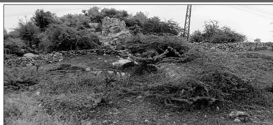
टोंक उपखण्ड के वन रेंज सोहेला में वृक्षारोपण सहित निर्माण कार्यो में जमकर धांधली करने का मामला सामने आया है।

टोंक, (निसं)। टोंक उपखण्ड के वन रेंज सोहेला में वृक्षारोपण सहित निर्माण कार्य में जमकर धांधली करने का मामला प्रकाश में आया है। प्राप्त जानकारी के अनुसार सोहेला वन क्षेत्र में बनी पुरानी दीवार को ही रंगरोगन कर नयी वॉल बताकर लाखों रूपये के फर्जी भुगतान उटाये गये हैं। सोहेला वन्य क्षेत्र में हर साल वन संरक्षण को लेकर प्लान्टेशन का निर्माण करवाया जाता है लेकिन वन अफसर नियमों को दरकिनार कर राशि का आहरण करते रहे हैं। ऐसी ही एक कहानी सोहेला वन नका क्षेत्र वैष्णो देवी प्लांटेशन में भारी भ्रष्टाचार देखने को मिल रही है। राष्ट्रीय राजमार्ग 52 पर स्थित वैष्णो देवी मंदिर के पास बनाए गए प्लांटेशन में भारी भ्रष्टाचार किया गया है। उक्त प्लांटेशन पर कई बार प्लांटेशन बनाए जा चुके हैं जबकि अफसरों द्वारा बार-बार नाम