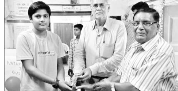
सुजानगढ़ में कम्प्यूटर सेंटर के स्थापना दिवस पर आयोजित प्रतियोगिता के विजेता का सम्मान करते अतिथिगण।