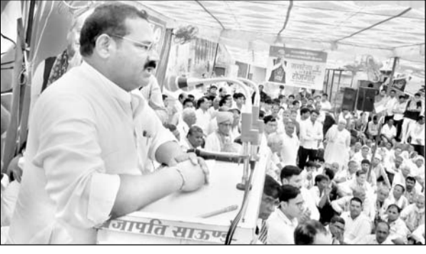
तारानगर में आयोजित कार्यकर्ता सम्मेलन में उपस्थित कांग्रेसी।