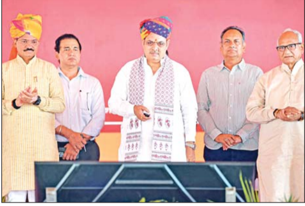
मुख्यमंत्री भजनलाल शर्मा ने शनिवार को बांदीकुई में महात्मा ज्योतिबा फुले की 200वीं जयन्ती पर आयोजित कार्यक्रम में दौसा जिले के विकास कार्यों का शिलान्यास एवं लोकार्पण किया।

ज्योतिबा फुले की 200वीं जयन्ती पर उन्होंने कहा कि प्रधानमंत्री ने महात्मा फुले के मिशन को आगे बढ़ाया