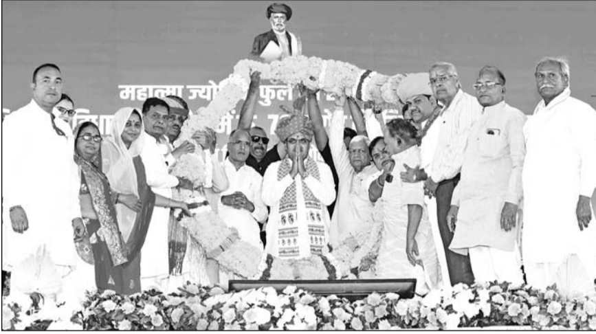
मुख्यमंत्री भजनलाल शर्मा ने शनिवार को कोटा के हिण्डोली में 70 करोड़ के विकास कार्यों का शिलान्यास-लोकार्पण किया। इस मौके पर स्थानीय पदाधिकारियों और आम जनता ने मुख्यमंत्री का गर्मजोशी से स्वागत किया।

बूंदी/जयपुर। मुख्यमंत्री भजनलाल शर्मा ने रामसागर झील के द्वितीय चरण के पर्यटन एवं विकास कार्य तथा महात्मा ज्योतिबा फुले एवं सावित्री बाई फुले की जीवनी पर आधारित पेनोरमा और पुस्तकालय बनाने की घोषणा की। उन्होंने रामसागर झील पर सीपेज की समस्या के समाधान के लिए भी आश्वासन दिया। उन्होंने कहा कि रामसागर झील के किनारे भगवान श्रीराम की 21 फीट ऊंची प्रतिमा बनाने पर यह आस्था का भी केन्द्र बनेगा। शर्मा शनिवार को महात्मा ज्योतिबा फुले जयंती के अवसर पर बूंदी के हिण्डोली में विकास कार्यों के शिलान्यास एवं लोकार्पण समारोह को सम्बोधित कर रहे थे। समारोह में मुख्यमंत्री भजनलाल शर्मा ने हिण्डोली में 70 करोड़ रुपये की लागत के 24 विकास कार्यों का शिलान्यास एवं लोकार्पण किया। इस दौरान जन स्वास्थ्य एवं अभियांत्रिकी मंत्री कन्हैयालाल चौधरी, ऊर्जा राज्य मंत्री (स्वतंत्र प्रभार) हिरालाल नागर, सांसद दामोदर अग्रवाल, विधायक गोपीचंद मीना मौजूद थे।