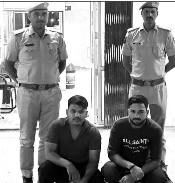
पुलिस ने सट्टा लगाते दो व्यक्तियों को गिरफ्तार किया।