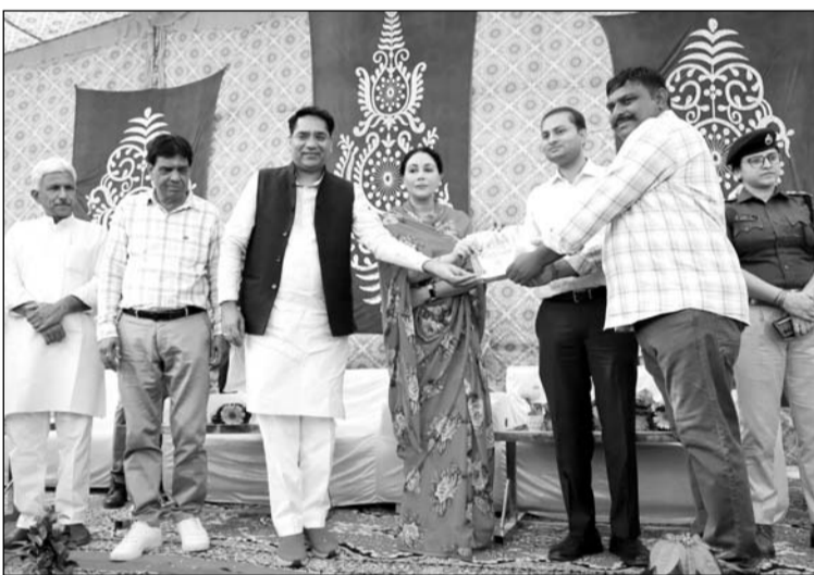
उपमुख्यमंत्री एवं जिले की प्रभारी मंत्री दिया कुमारी ने अन्तर्राष्ट्रीय पुष्कर मेला-2024 के समापन समारोह में पुरस्कार दिये।

अन्तर्राष्ट्रीय पुष्कर मेला-2024 के समापन कार्यक्रम में उपमुख्यमंत्री एवं जिले की प्रभारी मंत्री दिया कुमारी ने शिरकत की