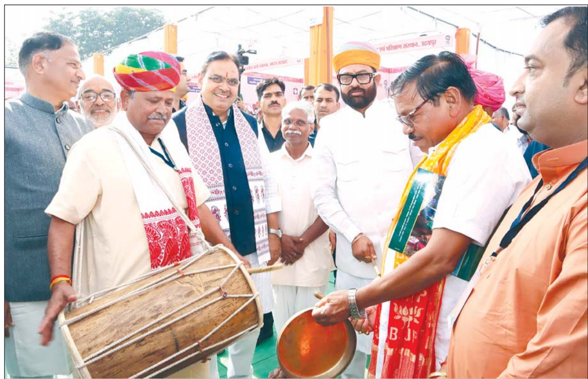
बांसवाड़ा में जनजातीय गौरव दिवस समारोह में मुख्यमंत्री भजनलाल शर्मा ने पारम्परिक वाद्ययंत्रों तथा उनके संगीत को देखा।