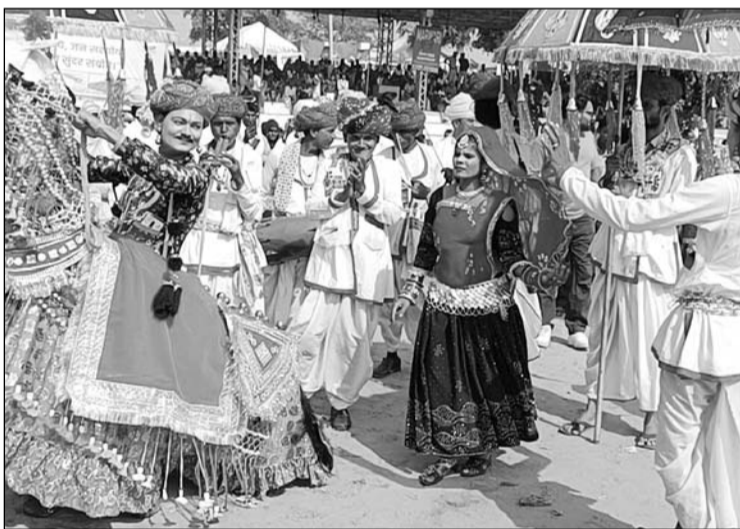
पुष्कर मेला समापन समारोह के दौरान रस्सा कस्सी, मटका दौड़, चम्मच रेस सहित कई रंगारंग कार्यक्रम आयोजित हुये।

अजमेर, (कासं) उपमुख्यमंत्री एवं जिले की प्रभारी मंत्री दिया कुमारी ने कहा कि तीर्थराज पुष्कर को अयोध्या और काशी की तर्ज पर विकसित किया जाएगा। अन्तर्राष्ट्रीय श्री पुष्कर पशु मेला प्रतिवर्ष पूर्ण भव्यता के साथ आयोजित होगा, केन्द्र व राज्य सरकार के समन्वित प्रयासों से राजस्थान अन्तर्राष्ट्रीय पर्यटन मानचित्र पर अग्रणी होगा। उप मुख्यमंत्री दिया कुमारी ने शुक्रवार को अन्तर्राष्ट्रीय पुष्कर मेला-2024 के समापन समारोह में मुख्य अतिथि के रूप में सम्बोधित किया।