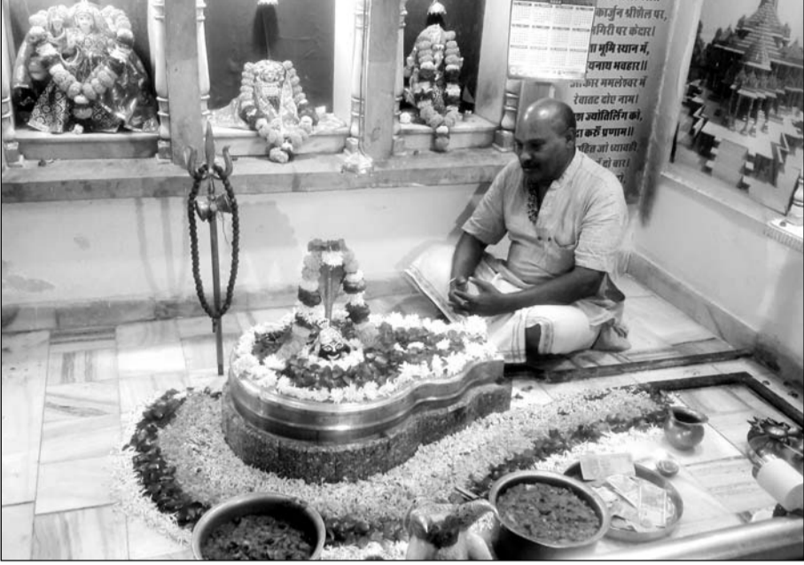
पाली में बागेश्वर महादेव मंदिर सहित कई मंदिरों में अन्नकूट महोत्सव मनाया।