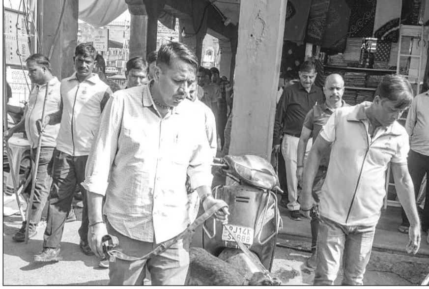
जयपुर में छोटी-बड़ी चौपड़ को बम से उड़ाने की धमकी मिलने के बाद पुलिस और डॉग स्कवॉड टीम ने परकोटा क्षेत्र में तलाशी अभियान चलाया।

जयपुर। राजधानी जयपुर में छोटी-बड़ी चौपड़ को बम से उड़ाने की धमकी मिलने के बाद पुलिस में खलबली मच गई। आनन-फानन में पुलिस और डॉग स्कवॉड टीम ने करीब 4 घंटे तक दोनों जगहों पर सर्च अभियान चलाया। तलाशी में कुछ भी नहीं मिलने पर पुलिस ने राहत की सांस ली। इस सर्च अभियान में सात थानों की पुलिस शामिल रही। बताया जा रहा है कि पुलिस ने इस मामले में एक युवक को डिटेंट कर लिया है।