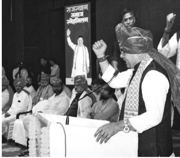
मुख्यमंत्री भजनलाल शर्मा ने शुक्रवार को महाराष्ट्र विधानसभा चुनाव के तहत पुणे के भोसरी में आयोजित राजस्थानी समाज सम्मेलन को संबोधित किया।

सहयोगी सिर्फ झूठ व लूट की बात करते हैं तथा महाअघाड़ी गठबंधन नहीं, बल्कि ठगबंधन है, जिसने जनता को ठगा है। महाराष्ट्र को ऐसे ठगबंधन की जरूरत नहीं है, जो जनता को थोड़े के सिवा कुछ न दे सके। चुनाव के समय अफवाहों को सफाया देने वाली कांग्रेस प्रत्याभार की जननी है, लेकिन महाराष्ट्र की जनता इन झूठकारियों को वोट की चोट से सबक सिखाएगी। उन्होंने कहा कि प्रधानमंत्री नरेंद्र मोदी दुनिया के सबसे मजबूत लीडर हैं, जिनके नेतृत्व में भारत का पूरी दुनिया में डंका बज रहा है। वर्ष 2014 के बाद आये परिवर्तन को सभी ने देखा है। गरीब कल्याण की योजनाएं, सीमाओं की सुरक्षा, आतंकवाद का खात्मा और दुनिया में बढ़ता हुआ गौरव इसका प्रमाण है। शर्मा ने कहा कि हर राजस्थानी राष्ट्र