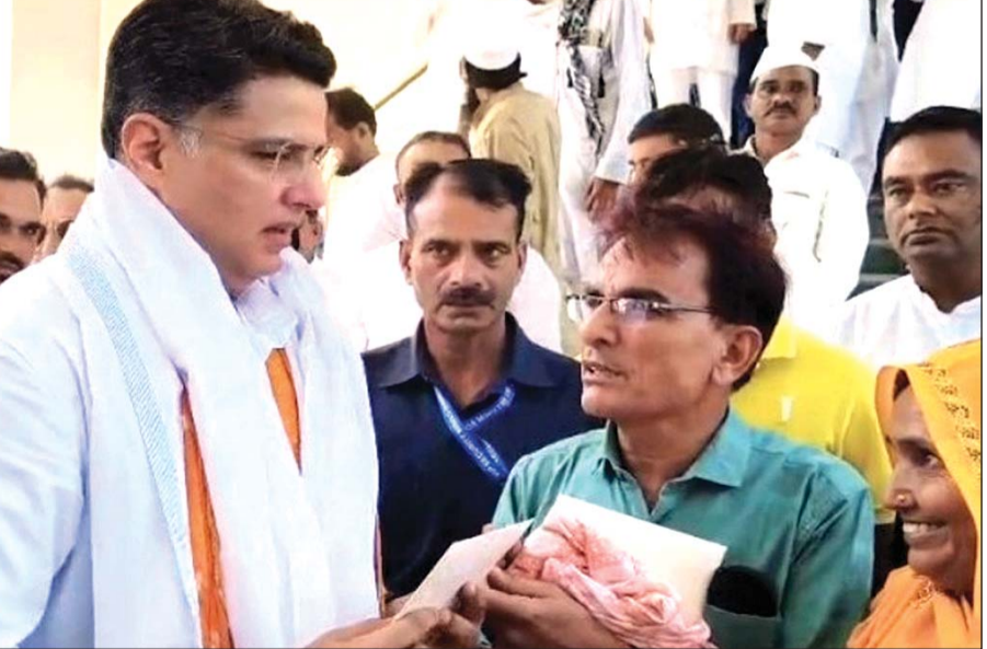
पूर्व उपमुख्यमंत्री व कांग्रेस के राष्ट्रीय महासचिव सचिन पायलट ने सोमवार को टोक के सर्किट हाउस में कार्यकर्ताओं से मुलाकात की और उनकी समस्याएं सुनीं।

भाजपा सरकार के आने के बाद से पंचायती राज संस्थाओं, नगर पालिकाओं और विश्वविद्यालयों के चुनाव नहीं कराए गए हैं, जबकि यह लोकतंत्र की मूल भावना के खिलाफ है, जो संविधान में भी अंकित है। पायलट ने कहा कि विपक्षी विधायकों तथा सांसदों के वजट में भेदभाव होता है, लेकिन हम जनता के काम करवाएंगे। उन्होंने बताया कि टोक के लिये मैडिकल कॉलेज, पुल और नर्सिंग कॉलेज जैसे कई प्रोजेक्ट बनाए गए हैं, लेकिन इन्हें अपेक्षित स्तर पर औपचारिक शुरुआत नहीं मिल पाई। कानूनी रूप से भी सरकार पर चुनाव कराने की जिम्मेदारी है, लेकिन न तो निर्वाचन आयोग और न ही सरकार इस दिशा में गंभीर दिख रही है। कोर्ट ने 15