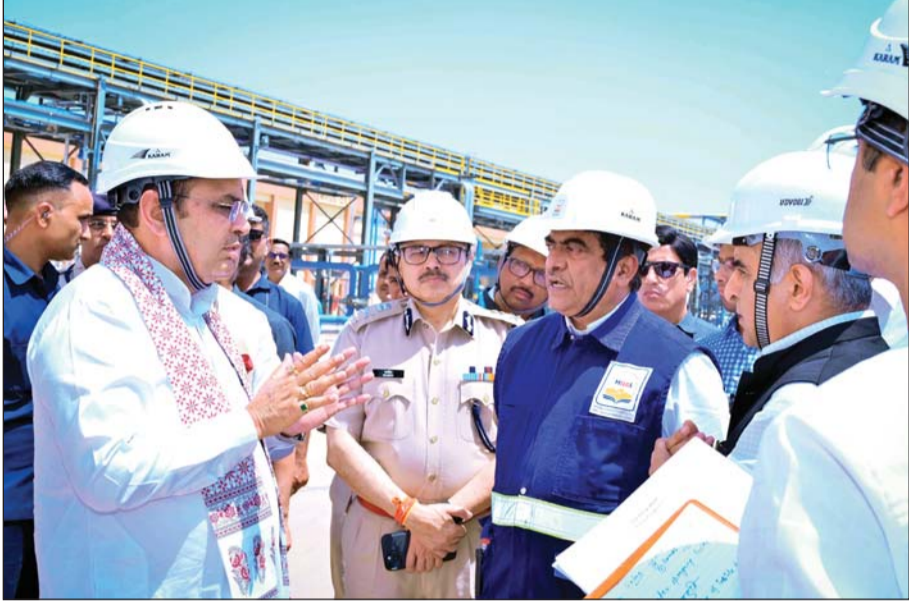
मुख्यमंत्री भजनलाल शर्मा ने सोमवार को बालोतरा के पचपदरा स्थित एचपीसीएल राजस्थान रिफाइनरी का दौरा कर व्यवस्थाओं का जायजा लिया।

इस दौरान शर्मा ने रिफाइनरी की क्लूड डिजिटेशन यूनिट, रिफाइनरी मेन कंट्रोल रूम का निरीक्षण किया। उन्होंने रिफाइनरी प्रतिनिधियों से संवाद कर उनका अनुभव भी जाना। मुख्यमंत्री ने कहा कि रिफाइनरी के माध्यम से प्रदेश की अर्थव्यवस्था को मजबूती मिलेगी तथा स्थानीय युवाओं को रोजगार के भरपूर अवसर प्राप्त होंगे। उन्होंने कहा कि प्रधानमंत्री इस मौके पर जनसभा को भी संबोधित करेंगे। मुख्यमंत्री ने