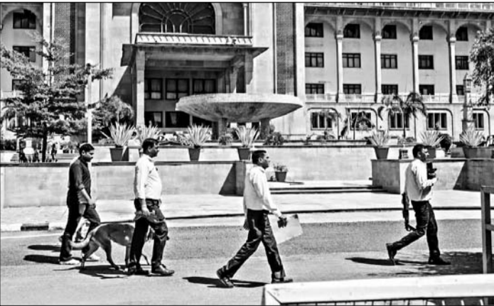
राजस्थान विधानसभा को आरडीएक्स से उड़ाने की धमकी मिलने की सूचना के सुरक्षा एजेंसियों, पुलिस और डॉग स्क्वाड ने चप्पे-चप्पे की तलाश ली।

जयपुर (कांस)। राजस्थान विधानसभा को आरडीएक्स से उड़ाने की धमकी भरा ईमेल मिलने के बाद सोमवार को हड़कंप मच गया, लेकिन सुरक्षा एजेंसियों की सघन जांच में यह धमकी पूरी तरह फर्जी पाई गई। इस मामले में विधानसभा अध्यक्ष वासुदेव देवनाबी ने तत्परता दिखाते हुए तुरंत राज्य के पुलिस महानिदेशक को सूचना दी और पूरे घटनाक्रम पर लगातार नजर बनाए रखी। एहतियातन विधानसभा अधिकारियों को खाली कराया गया, जिसके बाद बम निरोधक दस्ते और विशेष पुलिस बल ने मौके पर