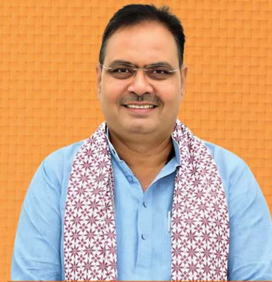
श्री भजनलाल शर्मा माननीय मुख्यमंत्री