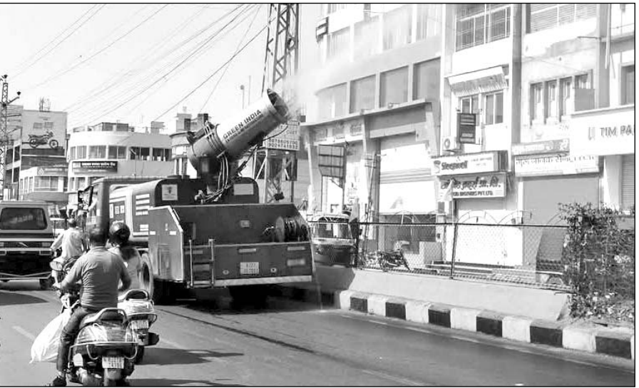
शहर के चौराहों पर निगम की ओर से फुहारों की बौछारें की जा रही है।

उदयपुर, (कासं)। प्रदेश में इस बार हीटवेव के अधिक समय तक रहने व दो दिन के अलर्ट के बीच लोकसिटी में पूरी तरह से भीषण गर्मी की जद में है। दो दिन से शहर में हीटवेव का असर देखा जा रहा है और रविवार के दिन तो भारी दुपहरी में हीट वेव इतनी तेज थी कि घर से बाहर निकलते ही लोग पुनः घरों की ओर दुबक गए। तापमान भी लगातार बढ़कर अब 41 डिग्री के करीब 40.9 डिग्री पर पहुंच गया। अप्रैल माह के पहले ही सप्ताह में तेज गर्मी का अहसास होने लगा है। लोकसिटी में हीटवेव के असर ने