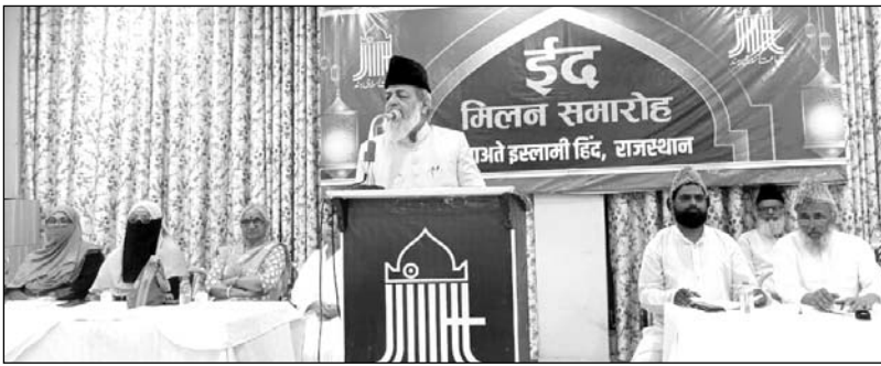
जमाअते इस्लामी हिन्द राजस्थान का ईद मिलन कार्यक्रम रविवार को आयोजित हुआ।

बेलफेयर पार्टी ऑफ इंडिया के प्रदेशाध्यक्ष ने कहा कि हम इस देश के वासी हैं और इस को बचाना