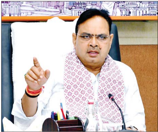
मुख्यमंत्री भजनलाल शर्मा ने जयपुर में प्रस्तावित राजस्थान मण्डपम की कार्ययोजना के संबंध में उच्चस्तरीय बैठक को संबोधित किया।

जयपुर, 17 मार्च। मुख्यमंत्री भजनलाल शर्मा ने कहा कि प्रदेश को 350 बिलियन डॉलर की अर्थव्यवस्था बनाने के लक्ष्य की पूर्ति के लिए राज्य सरकार औद्योगिक, पर्यटन एवं सांस्कृतिक गतिविधियों के प्रोत्साहन के लिए कृतसंकल्पित होकर कार्य कर रही है। उन्होंने कहा कि राजस्थान मंडपम के माध्यम से व्यापारिक एवं सांस्कृतिक कार्यक्रमों के लिए विश्वस्तरीय सुविधाएं उपलब्ध करवायी जाएंगी, ताकि प्रदेश बड़े-बड़े आयोजनों के लिए पहली पसंद बने और यहां कॉन्फ्रेंस टूरिज्म को बढ़ावा मिल सके। शर्मा ने सोमवार को मुख्यमंत्री निवास पर जयपुर में प्रस्तावित राजस्थान मण्डपम की कार्ययोजना के संबंध में उच्चस्तरीय बैठक को संबोधित किया। उन्होंने कहा कि राजस्थान मंडपम में होलिस्टिक अप्रोच के साथ आवश्यक व्यवस्थाओं एवं सुविधाओं की पुष्टा कार्ययोजना बनाई जाए ताकि यहां पर छोटे से लेकर बड़े प्रकार के आयोजन सुगमता से हो सके।