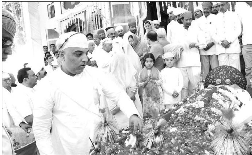
दिवंगत अरविन्द सिंह मेवाड़ का शाही रीति-रिवाज के साथ अंतिम संस्कार किया।