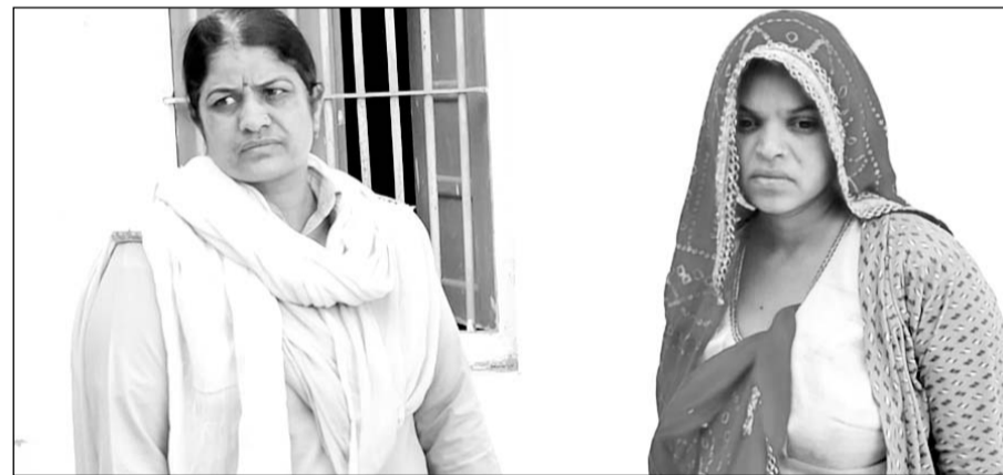
पुलिस ने मासूम बेटे की हत्या के आरोप में मां को गिरफ्तार किया।