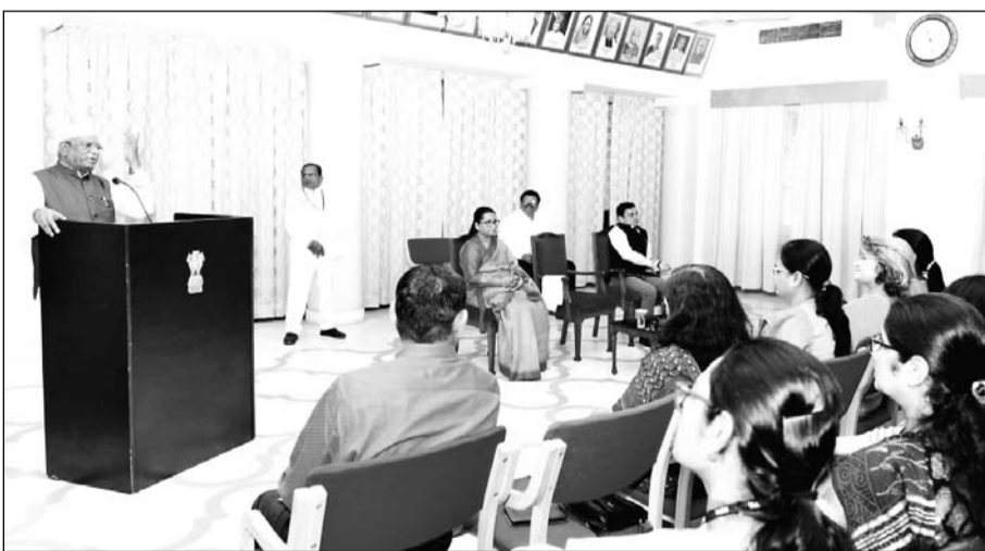
राज्यपाल हरिभाऊ बागड़े से राजस्थान प्रशासनिक और लेखा सेवा के प्रशिक्षु अधिकारियों ने भेंट की।

जयपुर। राज्यपाल हरिभाऊ बागड़े ने कहा है कि प्रशासनिक और लेखा सेवा में राष्ट्रहित को सर्वोपरि मानते हुए अधिकारी पूर्ण पारदर्शिता की कार्य की संस्कृति का विकास करें। उन्होंने समय के साथ जीवन प्रबंधन को जोड़ते हुए नैतिक मूल्यों के लिए कार्य करने पर जोर दिया। उन्होंने कहा कि राजकीय सेवा में आने के बाद अधिकारियों को यह चाहिए कि वे जन कल्याण से जुड़े कार्यों और विकास योजनाओं का प्रभावी रूप में क्रियान्वयन करें।