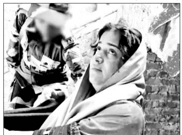
बीएसएफ ने भारत-पाक बॉर्डर पर घुसपैठ कर रही महिला को पकड़ा।

जांच कर रही है। वे यह पता लगाने का प्रयास कर रही है कि महिला का भारत