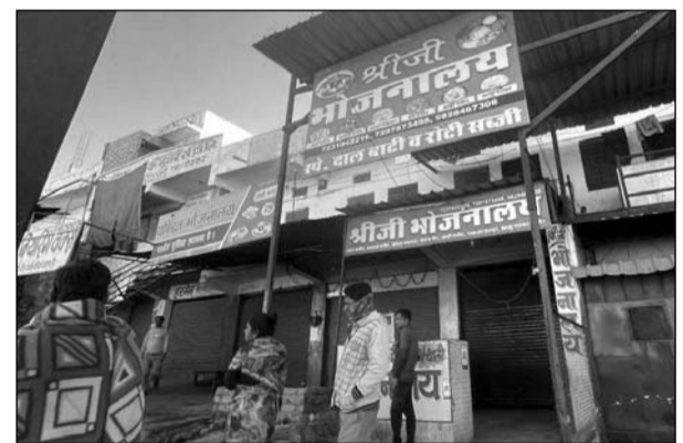
उदयपुर नगर निगम ने नगरीय विकास कर को लेकर कार्रवाई की।