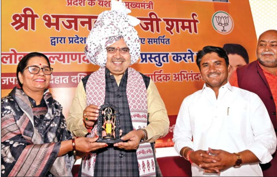
जयपुर देहात (दक्षिण) की ओर से आए प्रतिनिधिमंडल ने बजटीय घोषणाओं के लिए मुख्यमंत्री भजनलाल शर्मा का स्वागत किया। इस अवसर पर आमजन ने मुख्यमंत्री को स्मृति चिन्ह भेंट कर सम्मानित किया।

मुख्यमंत्री ने कहा कि इस वर्ष का मुख्यमंत्री भजनलाल ने कहा कि जयपुर के विस्तार के साथ, आस-पास के इलाकों में सुख-सुविधाओं के विस्तार के लिये बजट में अनेक प्रावधान किये गये हैं।