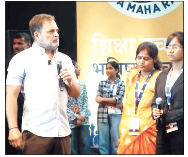
कांग्रेस के वरिष्ठ नेता राहुल गांधी ने कोटा के दशहरा मैदान से पेपर लोक मामले में छात्रों से संवाद अभियान की शुरुआत की है।

जितनी अपेक्षा की जा रही है। इसके पीछे कारण माना जा रहा था कि 21 जून को नीट का री-एग्जाम है तो ज्यादातर स्टूडेंट्स इस कार्यक्रम से दूरी बनाए रखेंगे। एक शंका यह भी थी कि लोकसभा स्पीकर ओम बिड़ला के कारण कोटा के बड़े कोचिंग इंस्टिट्यूट राहुल गांधी के इस आयोजन से दूरी बनाकर रखेंगे। पर कार्यक्रम स्थल पर इंजीनियरिंग और मेडिकल प्रवेश परीक्षाओं की तैयारी करने वाले स्टूडेंट्स पर्याप्त संख्या में नजर आए। छात्रों में पेपर लोक को लेकर भारी रोष नजर आया। निर्धारित समय शाम 8 बजे राहुल गांधी कार्यक्रम स्थल पर पहुंचे और