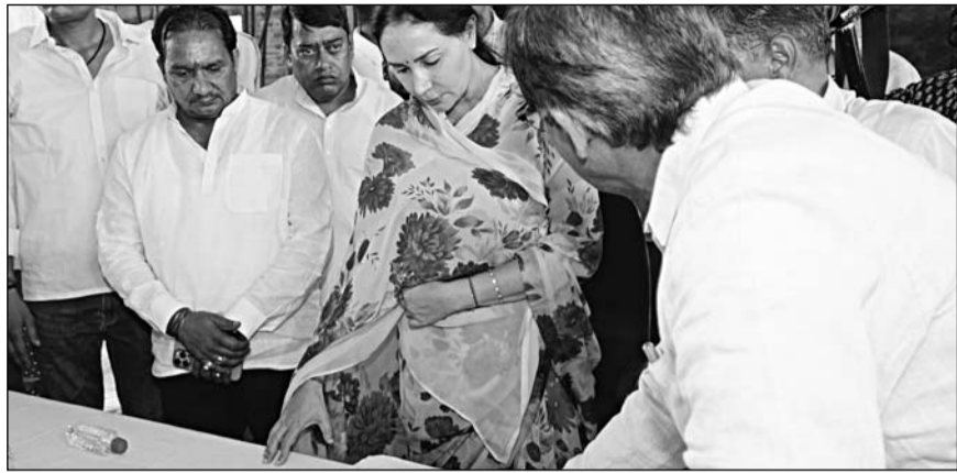
उपमुख्यमंत्री दिया कुमारी ने हॉस्पिटल का निरीक्षण कर निर्माण कार्यों की प्रगति का जायजा लिया।

जयपुर। उपमुख्यमंत्री दिया कुमारी ने बुधवार को 'प्रगति पथ यात्रा' कार्यक्रम के अंतर्गत विद्याधर नगर विधानसभा क्षेत्र में निर्माणाधीन सैटेलाइट हॉस्पिटल का निरीक्षण कर निर्माण कार्यों की प्रगति का जायजा लिया। इस दौरान उन्होंने संबंधित अधिकारियों को निर्माण कार्यों में