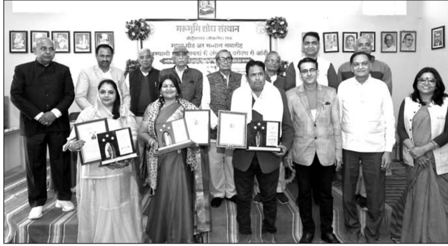
कार्यक्रम में साहित्यकारों व कवियों को सम्मानित किया गया।