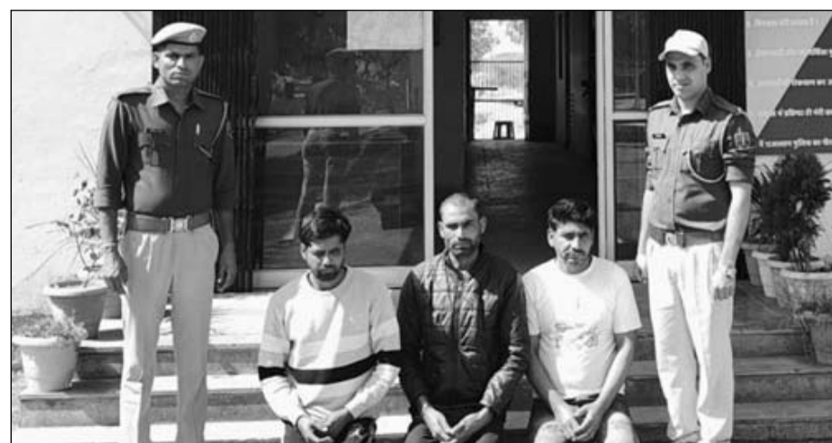
बरोल गांव में छात्र आत्महत्या के मामले में तीन आरोपियों को गिरफ्तार किया।