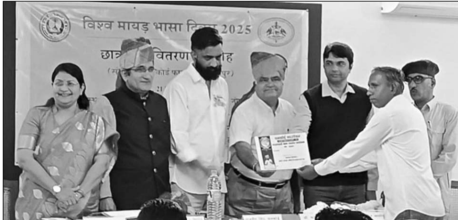
विश्व मायड़ भाषा दिवस पर आयोजित समारोह में अतिथियों का सम्मान किया गया।