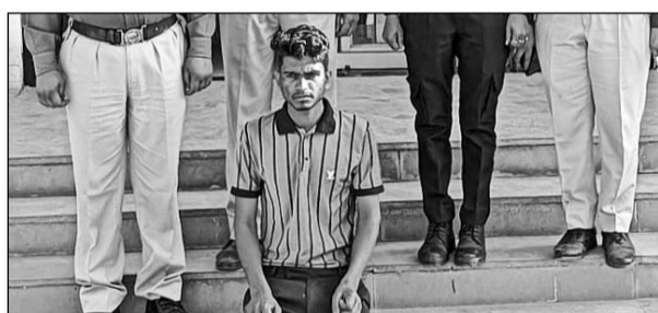
पुलिस ने दुष्कर्म के आरोपी को पकड़ा।

सांभरझील, (निसं)। युवती की अश्लील फोटो व वीडियो वायरल करने की धमकियां देकर दुष्कर्म करने के मामले में आरोपी को स्थानीय पुलिस ने गिरफ्तार किया। आरोपी घटना को अंजाम देने के बाद फरार हो गया था जिसे पुलिस ने महज 15 घंटे के अंतराल में ही दबोच लिया।