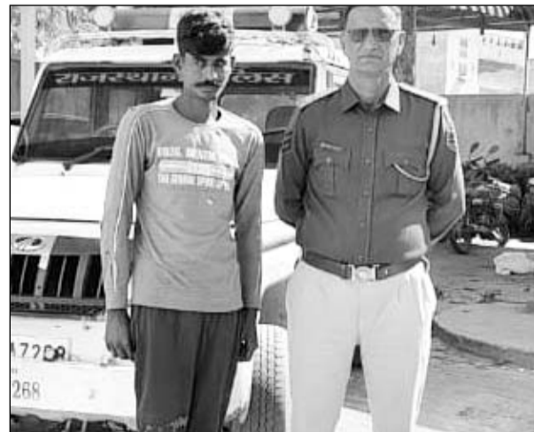
शराब के नशे में टोल कर्मचारियों से झगड़ा करने के आरोपी को गिरफ्तार किया।