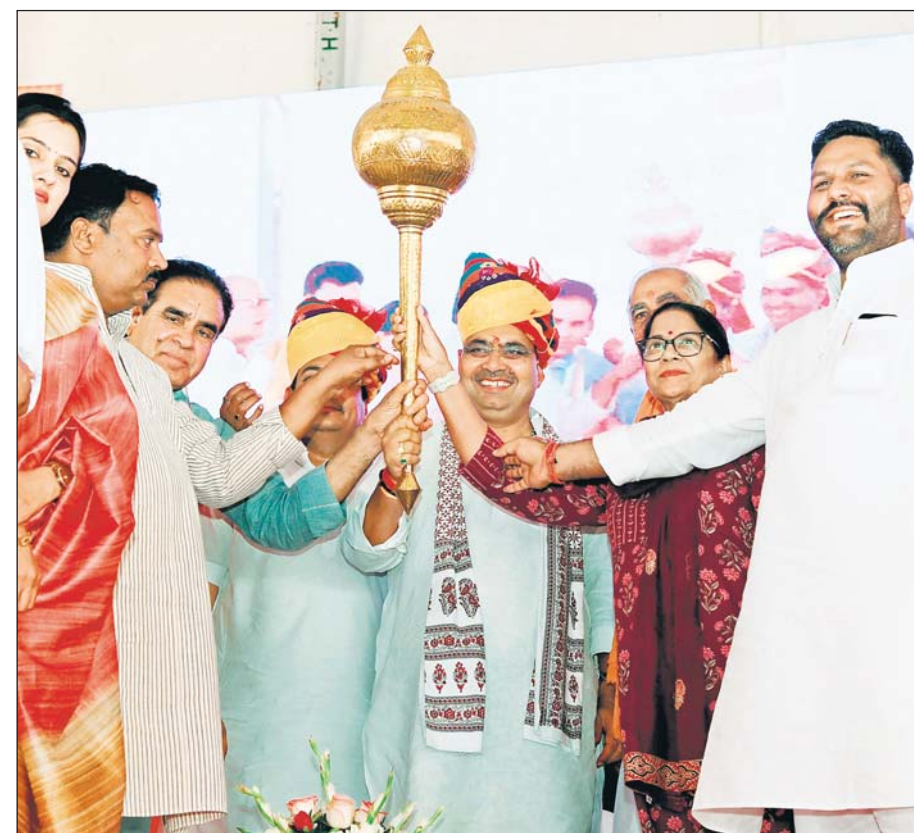
झुंझुनू में राज्य स्तरीय सामाजिक सुरक्षा पेंशन कार्यक्रम में भाजपा प्रदेश महामंत्री संतोष अहलावत व पूर्व विधायक शुभकरणा चौधरी ने मुख्यमंत्री भजनलाल शर्मा को गदा भेंट की।

राशि हस्तांतरण कार्यक्रम को संबोधित कर रहे थे। उन्होंने बटन दबाकर प्रदेश के 88 लाख से अधिक पेंशनरों के बैंक खातों में 1 हजार 37 करोड़ रुपए से अधिक की राशि हस्तांतरित की। इस अवसर पर उन्होंने कहा कि, हमारी सरकार मुख्यमंत्री वृद्धजन सम्मान पेंशन योजना, मुख्यमंत्री एकल नारी सम्मान पेंशन योजना, मुख्यमंत्री विशेष योग्यजन सम्मान पेंशन योजना, लघु एवं सीमांत वृद्धजन कृषक सम्मान पेंशन योजना के जरिए जरूरतमंदों को आर्थिक संबल प्रदान कर रही है। इस कार्यक्रम से पूर्व मुख्यमंत्री ने खेल मैदान में अंशक के पोषे का रोपण भी किया। मुख्यमंत्री ने कहा कि, राज्य (शेष अंतिम पृष्ठ पर)