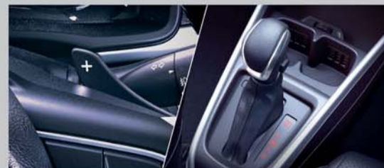
6-Speed Automatic Transmission with Paddle Shifters