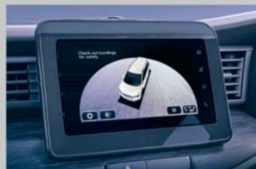
360 View Camera