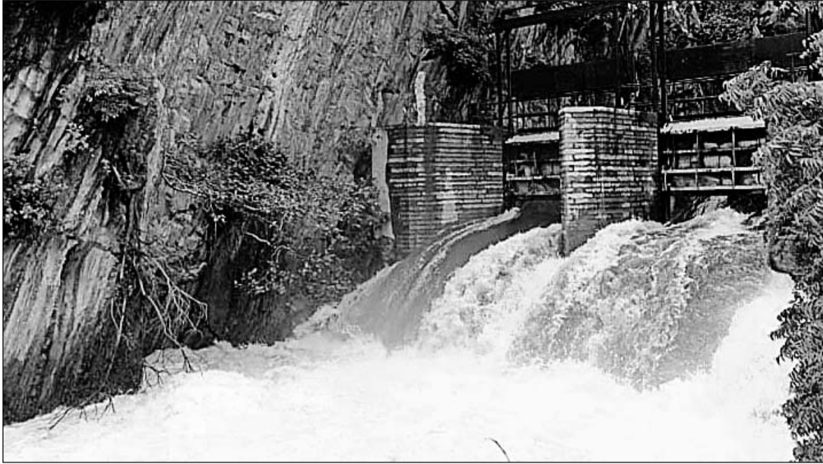
उदयपुर में लगातार बारिश व आयड़ नदी से हो रही पानी की आवक के चलते उदयसागर के दोनों गेट छह फीट खोल दिए गए।