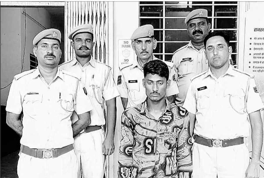
शहर कोतवाली पुलिस की गिरफ्त में शातिर वाहन चोर।

टोंक, (निसं)। शहर कोतवाली पुलिस ने शातिर वाहन चोर को गिरफ्तार किया है।