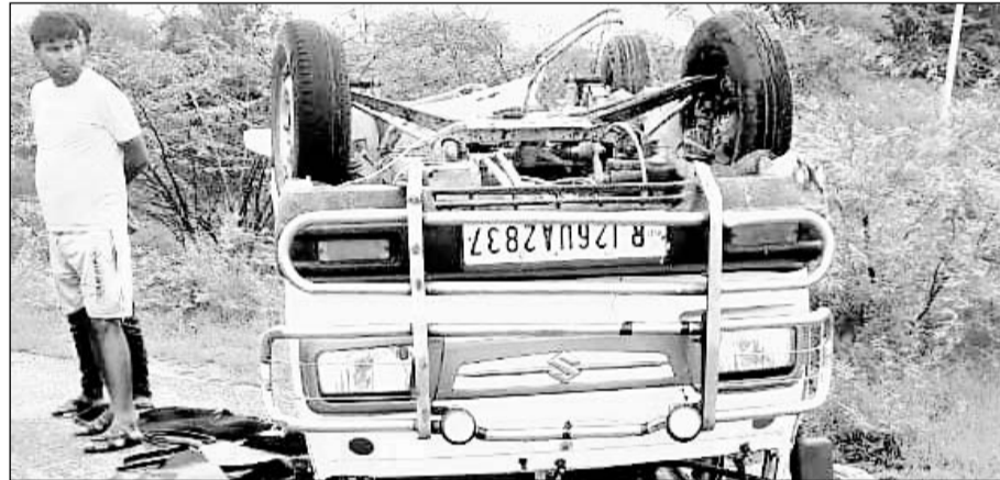
दूदू छाण स्टेट हाइवे पर अनियंत्रित हो बाइक से टक्कर के बाद पलटी वैन।