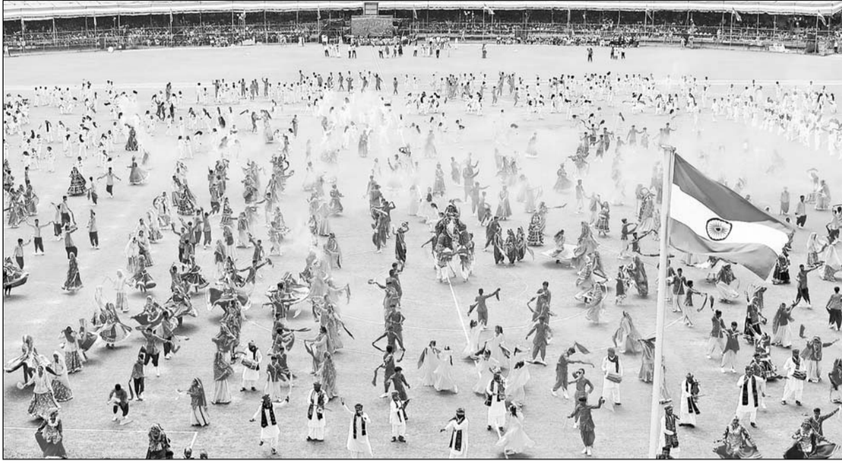
स्वतंत्रता दिवस के अवसर पर सवाई मानसिंह स्टेडियम में सैकड़ों स्कूली विद्यार्थियों और लोक कलाकारों ने देशभक्ति से ओतप्रोत कार्यक्रमों की प्रस्तुति दी और राजस्थानी लोक संस्कृति की छटा बिखेरी।