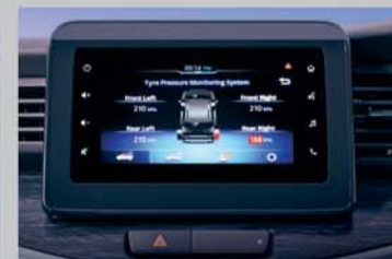
Tyre Pressure Monitoring System