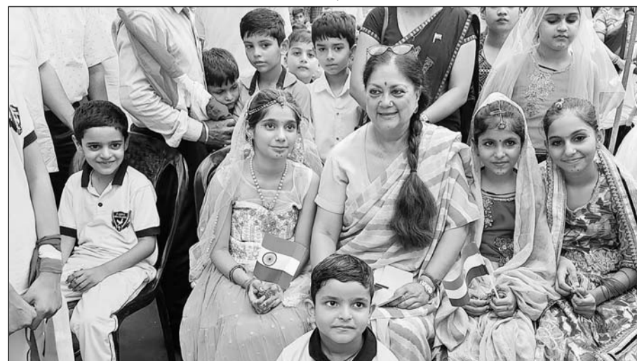
पूर्व मुख्यमंत्री वसुंधरा राजे ने निज निवास राज निवास पैलेस धौलपुर में स्वतंत्रता दिवस मनाया।

इस दौरान राजे काफी देर तक बच्चों के बीच जाकर बैठी रहीं और उन्हें टॉफियां वितरित की साथ ही बच्चों से बातचीत कर उनका उत्साह बढ़ाया। वहीं बच्चों ने एक से बढ़ कर एक सुंदर मंच पर प्रस्तुति दी। जिसको देखकर पूर्व मुख्यमंत्री वसुंधरा राजे गदगद हो गईं और उन्होंने जमकर तालियां बजाईं तथा बच्चों की प्रस्तुति की सराहना की। इसके बाद राजे ने एक-एक कार्यक्रमों से मंच पर मुलाकात की और उन्हें अपने हाथ से स्वतंत्रता दिवस की मिठाई भेंट की। इसके अलावा वरिष्ठ और पुराने कार्यकर्ताओं से उनके हालचाल जाने,