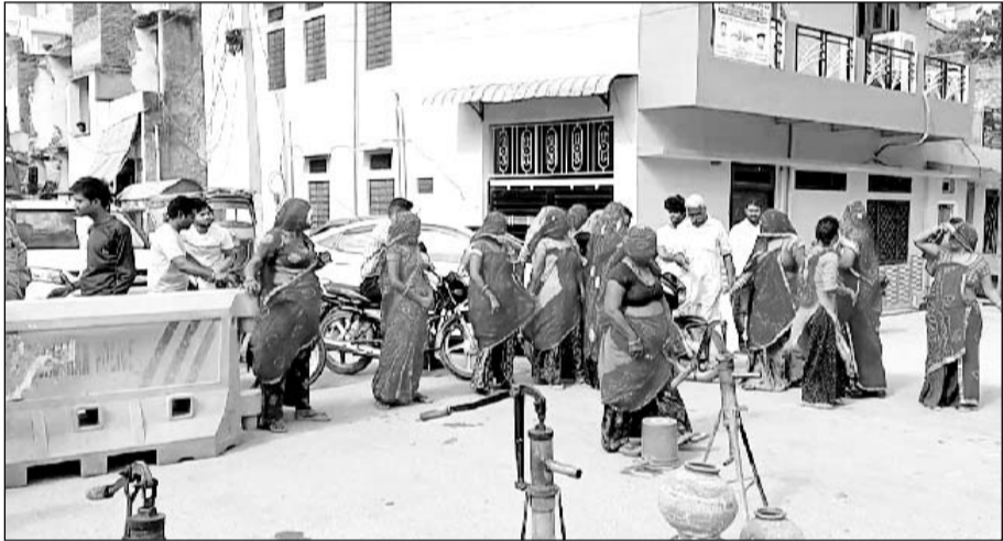
पाटन में पानी समस्या को लेकर ग्रामीणों ने जाम लगाया।

पाटन (निसं)। नीमकाथाना उपखंड क्षेत्र के वार्ड नंबर 33 व 35 में पानी से परेशान आक्रोशित लोगों ने खेतड़ी मोड़ व गणेश चोक पर जाम लगा दिया।