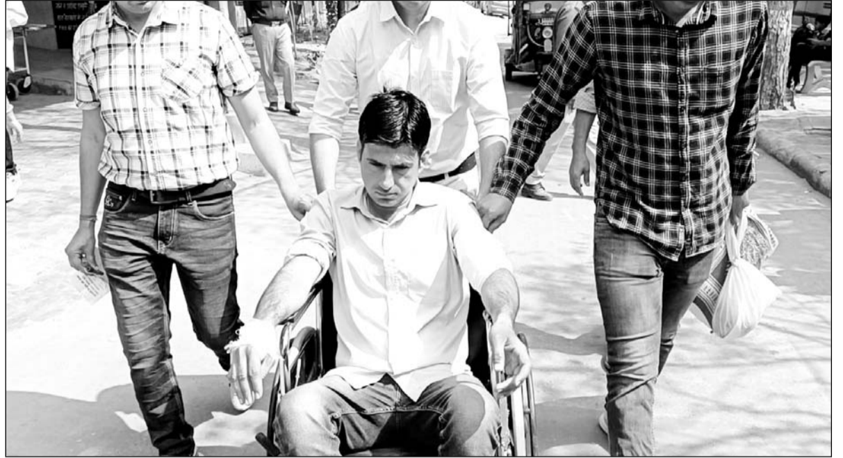
बदमाशों से मुठभेड़ के दौरान एक पुलिसकर्मी घायल हो गया।

झुंझुनू/सूरजगढ़, (निर्स)। थाना इलाके के कुलोठ खुर्द गांव में तीन दिन पहले एक परिवार को बंधक बनाकर पिस्टल की नोक पर की गई डकैती का पुलिस ने खुलासा कर दिया है। पुलिस ने इस मामले में हरियाणा की शांति बावरिया गैंग के सात सदस्यों के अलावा रैकी करने वाले एक स्थानीय आरोपी को गिरफ्तार किया है। बदमाशों ने पुलिस से भागने के चक्कर में फायरिंग भी की। जिसमें ना केवल एक पुलिसकर्मी, बल्कि दो बदमाश भी गोली लगने से घायल हो गए। जिनका ईलाज झुंझुनू के राजकीय बीडीके अस्पताल में चल रहा है।