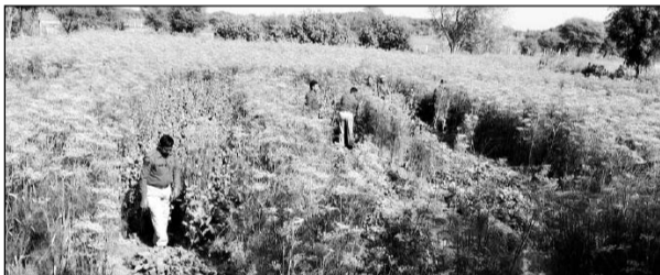
पुलिस ने अवैध रूप से अफीम डोडा-पोस्त की खेती पकड़ी।