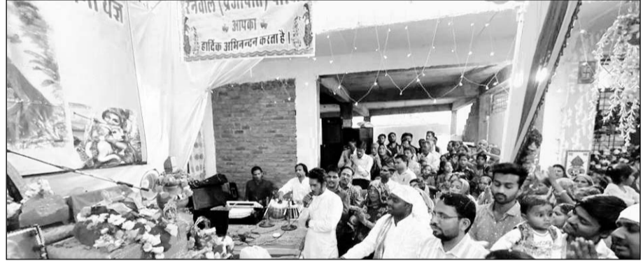
कोटा के त्रिलोकी महादेव मंदिर में श्रीमद् भागवत कथा का समापन हुआ।