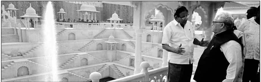
राज्यपाल कलराज मिश्र ने कोटा में चम्बल नदी पर बने रिबर फ्रंट सहित अन्य जगहों का अवलोकन किया।

कोटा, (निर्स)। राज्यपाल कलराज मिश्र ने कहा कि चम्बल नदी पर बना रिबर फ्रंट स्थापत्य की दृष्टि से अतुलनीय है, प्रत्येक घाट का निर्माण भारतीय संस्कृति ओत-प्रोत है। आने वाले समय में देश-दुनिया के पर्यटकों के लिए आकर्षण का केन्द्र होगा। राज्यपाल कलराज मिश्र बुधवार को कोटा में निर्माणाधीन चम्बल रिबर फ्रंट के अवलोकन के उपरांत मीडिया से रूबरू हो रहे थे।