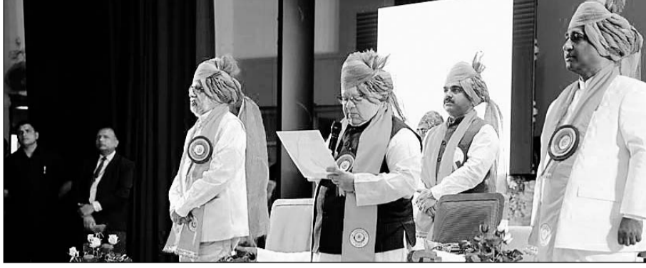
राज्यपाल कलराज मिश्र ( बीच में ) ने राजस्थान तकनीकी विश्वविद्यालय के 12 वें दीक्षांत समारोह में शिरकत की।

नहीं रहते हुए विद्यार्थियों को व्यवहारिक एवं कौशल परक शिक्षा प्रदान की जानी चाहिए ताकि वे बेहतर समाज का निर्माण करने में योगदान कर सकें। राजस्थान मिश्र बुधवार को कोटा के यूआईटी ऑडिटोरियम में राजस्थान तकनीकी विश्वविद्यालय के 12 वें