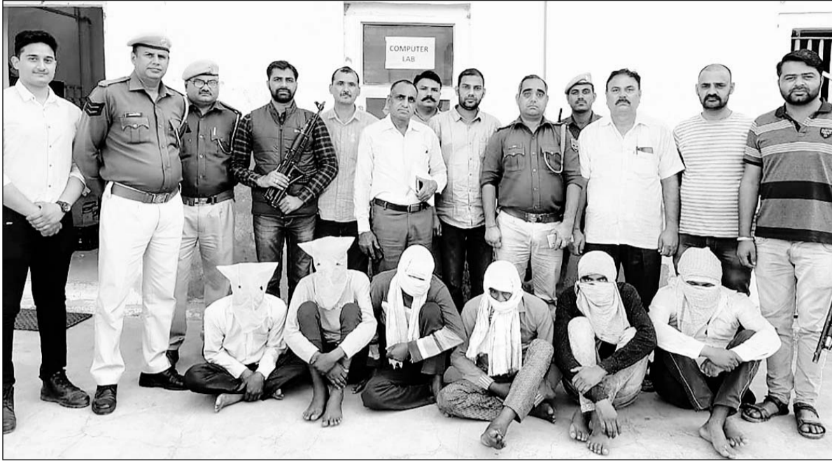
पुलिस ने हरियाणा की शांति बावरिया गैंग के सात सदस्यों के अलावा रैकी करने वाले एक स्थानीय आरोपी को गिरफ्तार किया।

बदमाशों और पुलिस के बीच मौका तस्दीक के दौरान हुई मुठभेड़, आरोपियों ने पुलिस की रिवाल्वर से ही पुलिस पर फायरिंग कर दी