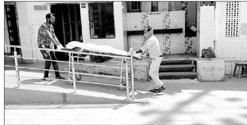
जहाजपुर थाना पुलिस ने शवों को हॉस्पिटल की मोर्चरी में रखवाया।

बाइक पर मां-बेटी व पिता देवली के राजनगर से भीलवाड़ा जा रहे थे