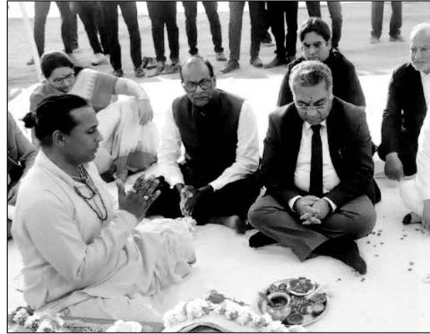
मुख्य न्यायाधीश एम.एम. श्रीवास्तव बुधवार को फैमिली कोर्ट के अलग भवन के लिए आयोजित भूमि पूजन समारोह में शामिल हुए।

जयपुर, (का.सं.)। राजस्थान हाईकोर्ट के मुख्य न्यायाधीश एमएम श्रीवास्तव ने कहा कि फैमिली कोर्ट पारिवारिक मामलों के निस्तारण के लिए बने हैं। यहां की प्रक्रिया अन्य न्यायालयों से अलग होती है। यहां वकील, काउंसलर और जज पक्षकारों में सुलह का प्रयास करते हैं। इन अदालतों में बच्चों की अभिरक्षा के मामले भी आते हैं। जिसके चलते इन अदालतों में परिवार के लोग भी आते हैं। ऐसे में फैमिली कोर्ट का भवन न केवल अच्छा हो, बल्कि आने वाले परिवार के लोगों के बैठने के लिए भी समुचित व्यवस्था होनी चाहिए। इसलिए फैमिली कोर्ट का अपना अलग से भवन भी होना चाहिए। सीजे श्रीवास्तव बुधवार को फैमिली कोर्ट के अलग भवन के लिए आयोजित भूमि पूजन समारोह में उपस्थित वकीलों सहित अन्य लोगों को संबोधित कर रहे थे।