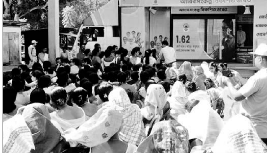
विकसित भारत संकल्प यात्रा कई गांवों में पहुंची।

इलेक्ट्रॉनिकी और सूचना प्रौद्योगिकी मंत्रालय द्वारा विकसित किए गए कस्टमाइज्ड पोर्टल पर दर्ज आंकड़ों के अनुसार 7 दिसम्बर, 2023 तक यह यात्रा 36,000 से अधिक ग्राम पंचायतों तक पहुंच चुकी है और 1 करोड़ से अधिक नागरिकों की भागीदारी इसमें देखी गई है। भारत का सबसे अधिक आबादी वाला राज्य उत्तर प्रदेश 37 लाख से अधिक लोगों की भागीदारी के साथ इसमें सबसे आगे है। इसके बाद महाराष्ट्र में 12.07 लाख और गुजरात में 11.58 लाख लोगों ने भाग लिया। इस यात्रा को जम्मू-कश्मीर में भी जोश भरा स्वागत किया है, जहां से अब तक 9 लाख से अधिक लोग भाग ले चुके हैं। हर गुजरते दिन के साथ लोगों की भागीदारी में और तेजी आई है। संकल्प