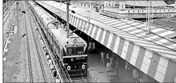
गंगापूर सिटी में बिजली का तार टूटने से रेलवे ट्रेन पर खड़ी ट्रेनें।

गंगापूर सिटी, (निंसां)। कोटा-सवाईमाधोपुर रेलखंड पर देर रात महाराष्ट्र सम्पर्क क्रांति एक्सप्रेस से बिजली (ओएचई) के तार टूटने से कोटा-मथुरा अप लाइन पर करीब 7 घंटे यातायात उप रहा। राजधानी समेत पांच ट्रेनें प्रभावित हुईं। केशवरायपाटन व अरनेटा के बीच हुई ओएचई तार टूटा। अचानक हुई इस घटना के बाद कोटा व लाखेरी से टावर वैगन व इंजीनियरिंग टीम मौके पहुंची। तड़के करीब 4 बजे लाइन को दुरुस्त किया गया। तब जाकर अप लाइन पर यातायात सुचारु हुआ।