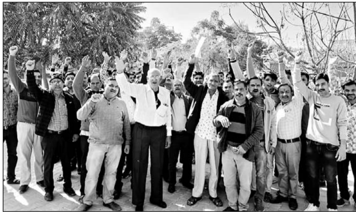
बीदासर में स्वर्णकार समाज के लोगों ने रैली निकाली।

वारदात को लेकर स्वर्णकार समाज में रोष, रैली निकालकर ज्ञापन दिया