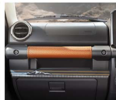
INTERIOR STYLING KIT