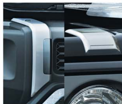
FRONT BUMPER AND HOOD GARNISH