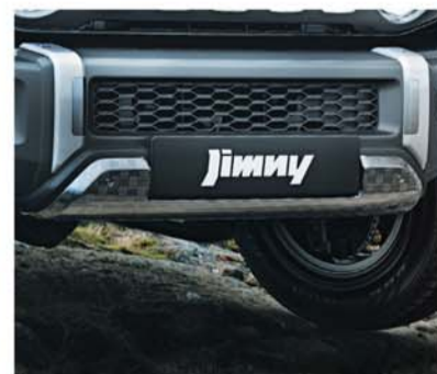
FRONT SKID PLATE