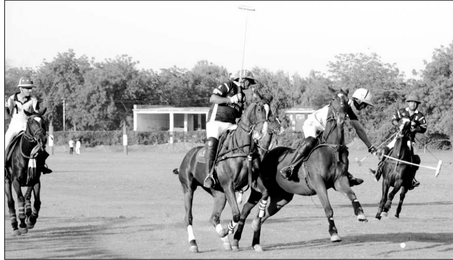
जोधपुर पोलो सीजन-2023 में उम्मेद भवन पैलेस कप पोलो ( 4 गोल ) टूर्नामेंट के तीसरे दिन दो मैच खेले गये।

दूसरे मैच में इण्डियन नेवी की टीम विजयी रही, फाईनल में उम्मेद भवन पैलेस व इण्डियन नेवी टीमों ने प्रवेश किया