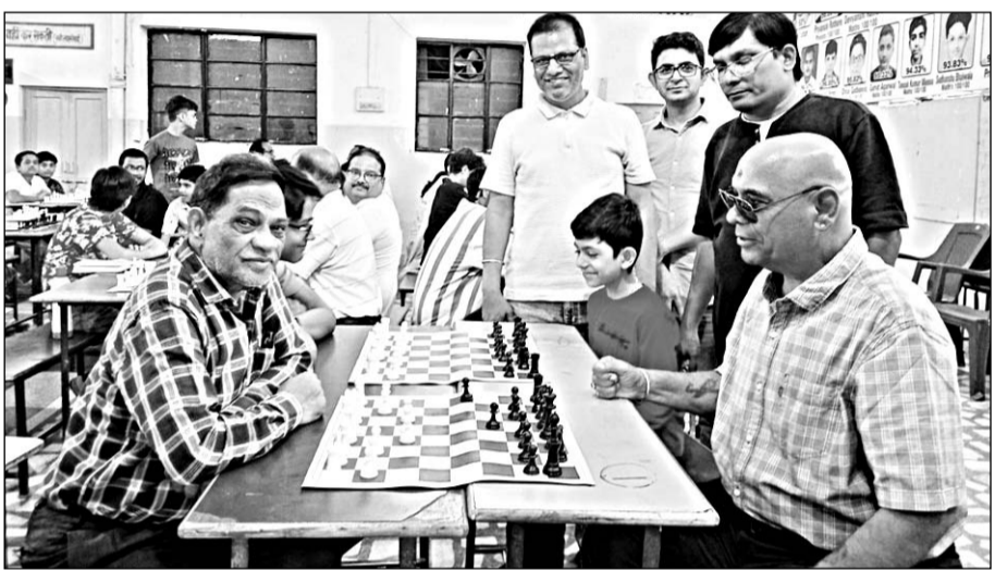
जिला शतरंज संघ कोटा के तत्वावधान में जिला स्तरीय सीनियर शतरंज प्रतियोगिता का आयोजन किया जा रहा है।

शीर्ष महिला खिलाड़ी तथा शीर्ष सीनियर सिटीजन खिलाड़ी को भी नकद पुरस्कार दिया जाएगा। इसके अतिरिक्त सभी आयु वर्गों के विजेता व उपविजेता