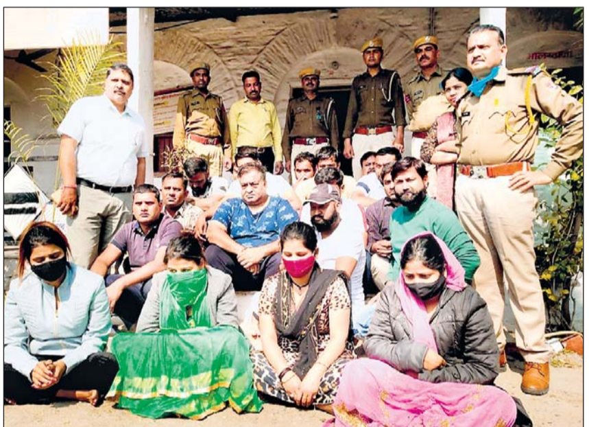
राजसमंद पुलिस ने एक होटल में रेड डालकर यहां रेव पार्टी कर रहे 18 युवक-युवतियों को गिरफ्तार किया है।

केन्द्र सरकार ने राजस्थान राज्य विद्युत उत्पादन निगम लिमिटेड