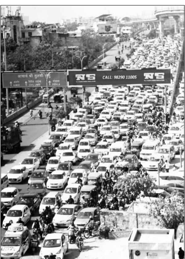
रीट की सीबीआई जांच की मांग के लिए भाजपा कार्यकर्ता मंगलवार को विधानसभा घेरने निकले। इस कारण शहर में जगह-जगह पर भारी ट्रैफिक जाम लग गया। अजमेर पुलिसिया पर आलम यह था कि वाहन रैंग-रैंग कर चल रहे थे।