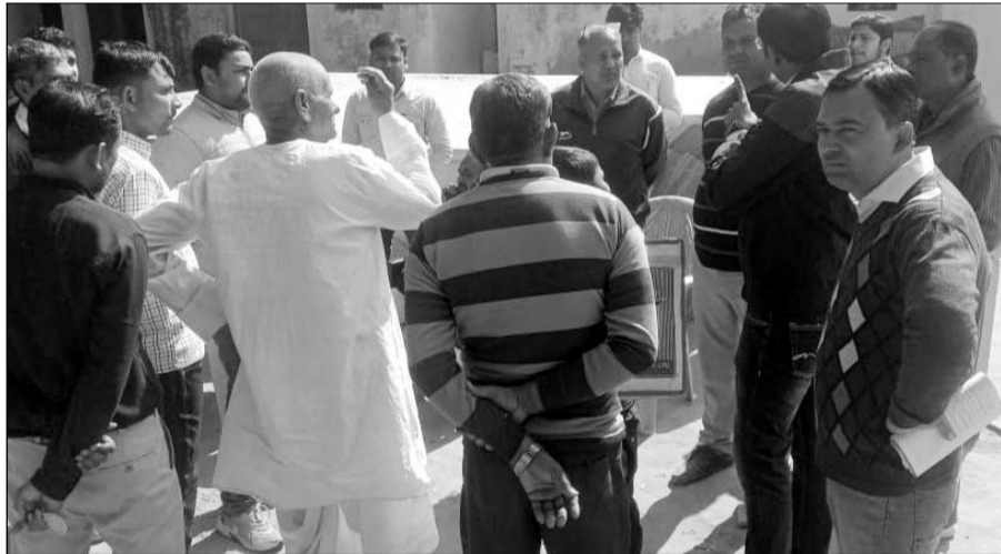
सीनियर स्कूल बदरिका में हुई फायरिंग की घटना के बाद ग्रामीणों ने आरोपी को दबोचा।

धौलपुर, (निर्स)। धौलपुर जिले के कौलारी थाना इलाके के राजकीय उच्च माध्यमिक विद्यालय बदरिका में मंगलवार को छात्रों में झगड़ा हो गया। जिस पर छात्रों के परिजन मौके पर पहुंच गए जिन्होंने फायरिंग कर दी। जिससे स्कूल में दहशत फैल गई। वहीं झगड़े के दौरान एक छात्र गंभीर रूप से घायल हुआ है। हालांकि कुछ लोगों का कहना है कि आरोपी ने मौके पर फायरिंग नहीं की, केवल अवैध कट्टा हवा में लहराया था। वहीं ग्रामीणों ने आरोपी को मौके पर ही अवैध कट्टा और कारतूस सहित दबोच