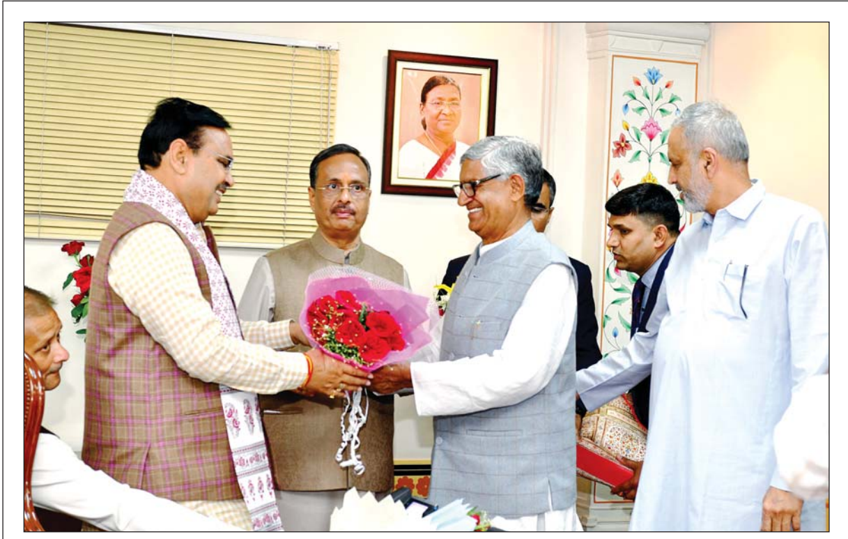
मुख्यमंत्री भजनलाल शर्मा से मंगलवार को विधानसभा में संसदीय राजभाषा समिति गृह मंत्रालय की प्रथम उप समिति के संयोजक और सांसद डॉ. दिनेश शर्मा एवं समिति के सदस्यों ने मुलाकात की। डॉ. दिनेश शर्मा उत्तर प्रदेश से राज्यसभा सांसद हैं और 2017 से 2022 तक उत्तर प्रदेश के उपमुख्यमंत्री रहे हैं। डॉ. दिनेश शर्मा के नेतृत्व वाली उपसमिति विभिन्न सरकारी कार्यालयों में हिन्दी कार्य संचालन का निरीक्षण करती है।