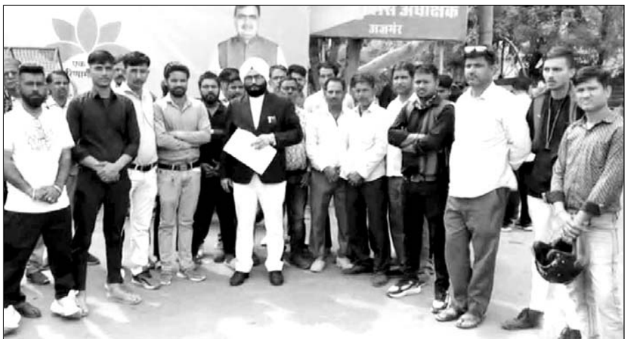
कलेक्ट्रेट पर पीड़ित लोगों ने प्रदर्शन किया।